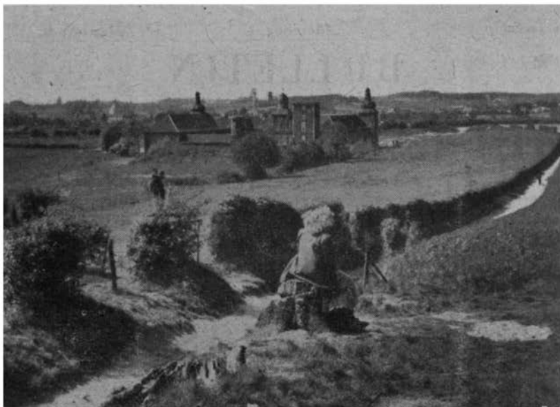
Ruine „Slot Schaesberg“