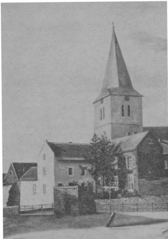
Reconstructietekening van het tegenwoordige Emmaplein, ± 1900.

Op de voorgrond rechts: hek en walmuur, waartussen een overblijfsel van de eerste watergordel van het voormalige fort Herle. In het midden: het barrierhuisje. Daarnaast is het hek van de kerkhofsbrug zichtbaar. Rechts achter de walmuur: de voormalige pastorie. Links achter het barrierhuisje: de woning van de familie Canter.