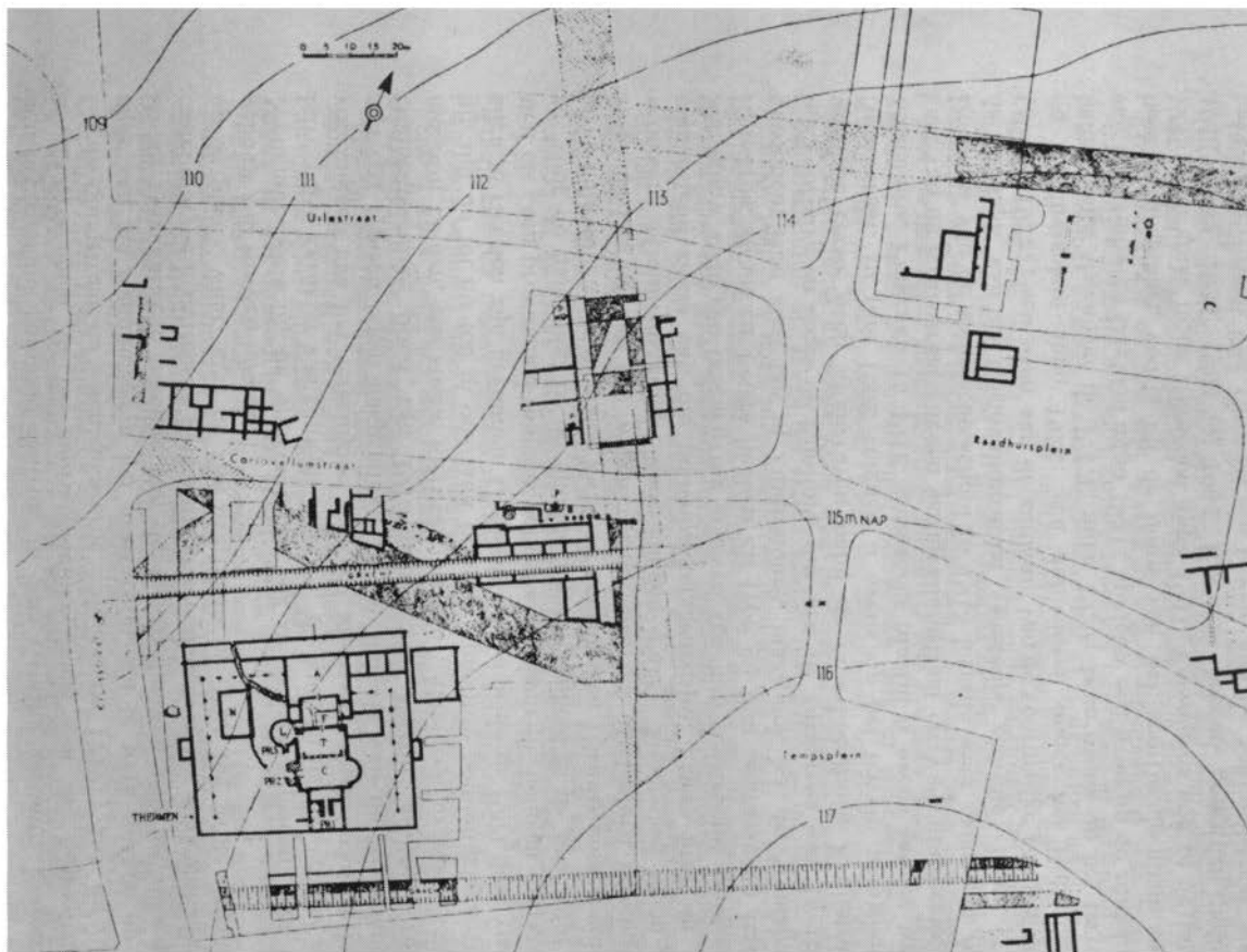
Stenen gebouwen, pottenbakkersovens, wegen en grachten van romeins Heerlen; uit: J. E. Bogaers: Militaire en burgerlijke nederzettingen in romeins Nederland; in: Honderd eeuwen Nederland; Den Haag 1959, p. 151.