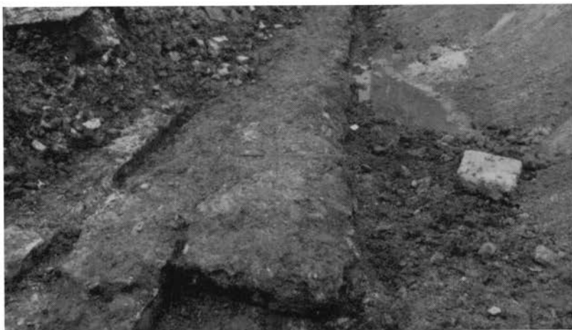
Restant van de walmuur (in tekening gemerkt nr 1).