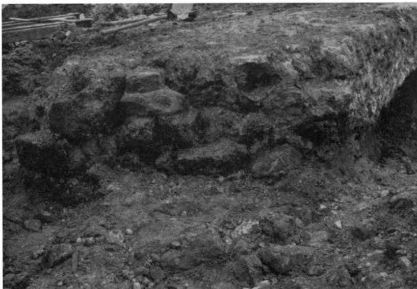
Teruggevonden gedeelte van de walmuur aan de zijde van de Bongerd. (In tekening gemerkt nr 4.)