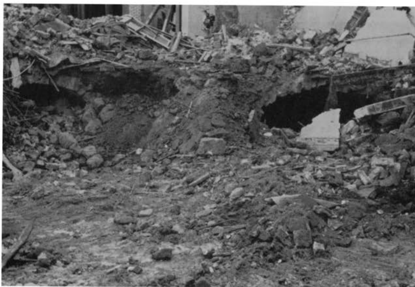
Gewelfde kelders onder het pand „Het Witte Huis”, Emmastraat.