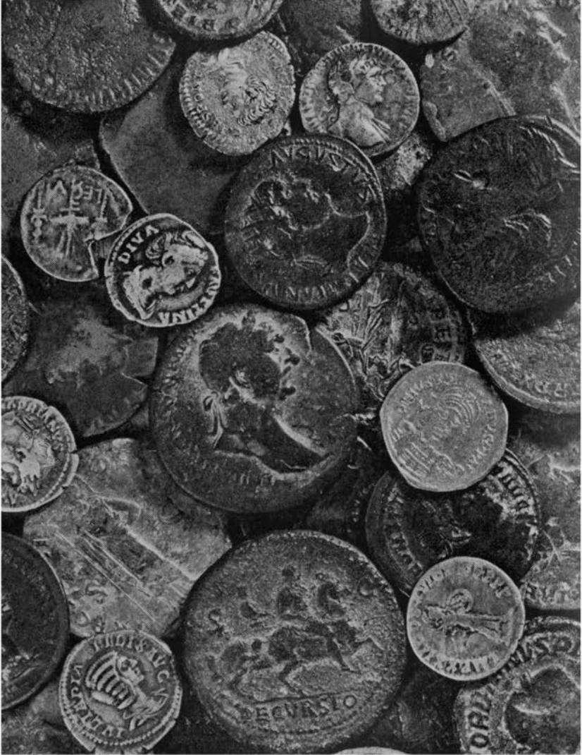
Romeinse munten uit de collectie van het Gemeentelijk Oudheidkundig Museum Heerlen.