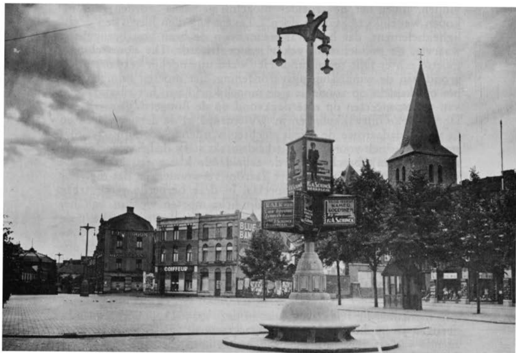
Het Heerlense Marktplein, ± 1933, met drie-armige verlichtingsmast en rustbank.

Spoedig daarna werd eenzelfde besluit t.b.v. de bewoners van Heerlerheide genomen 147 ). Als marktdag koos men iedere tweede woensdag van de maand. Ook hier kon alles ten verkoop aangeboden worden met uitzondering van dranken, druk- en plaatwerk en „zoogenaamde sanitaire artikelen”.