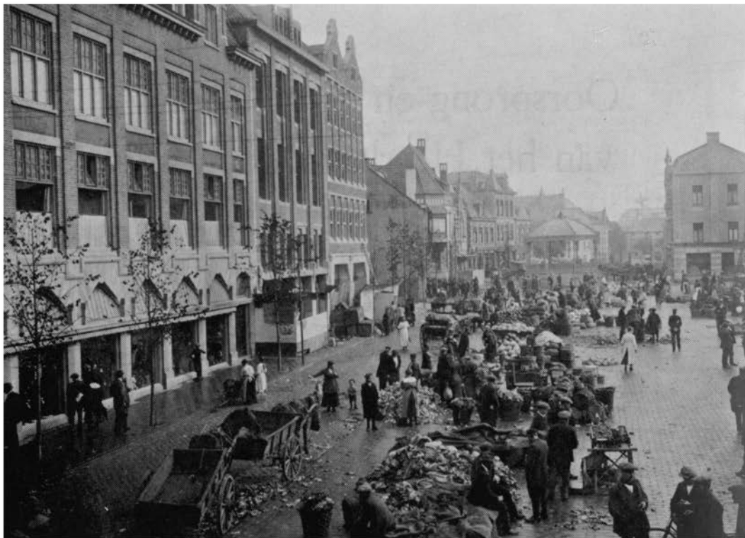
Het Marktplaatsje tijdens een marktdag, ± 1921, met op de achtergrond de gemeentelijke muziekkiosk.

waarmee op de aanvraag van de Werkliedenbond afwijzend werd beschikt 133 ).