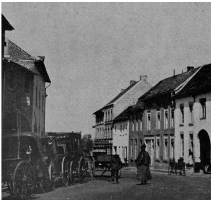
Huurkoetserie Geurten Emmastraat.

Overigens bestond er natuurlijk gelegenheid rijtoeren te maken met deftige equipages, zoals landouwers en coupé's. Niet weinigen maakten gebruik van chaise of brik (o.a. artsen, kooplieden, heerboeren e.d.). Het goederenvervoer geschiedde met cammignons, ponny- en huifkarren. Het particulier verkeer in de tweede helft der vorige eeuw was zelfs zeer levendig. Clubs en verenigingen trokken er gewoonlijk per „Jan Plezier” op uit; soms ook wel met grote boerenwagens, die dan bij deze gelegenheden met boomtakken, bloemen enz. werden getooid. Vooral 's zondags kwamen bezoekers uit Aken en omgeving naar Heerlen, zodat de Akense „Droschkenkutscher” met hun hoge hoeden en hun fraaie landouwers, met twee paarden bespannen, hier geen zeldzaamheid meer waren. 't Is begrijpelijk, dat destijds de huurkoetsiers goede zaken maakten. Bekendheid verwierf de huurkoetserie van Stessen (later Stessen-Nelissen). De ondernemer Schils onderhield eveneens het verkeer met