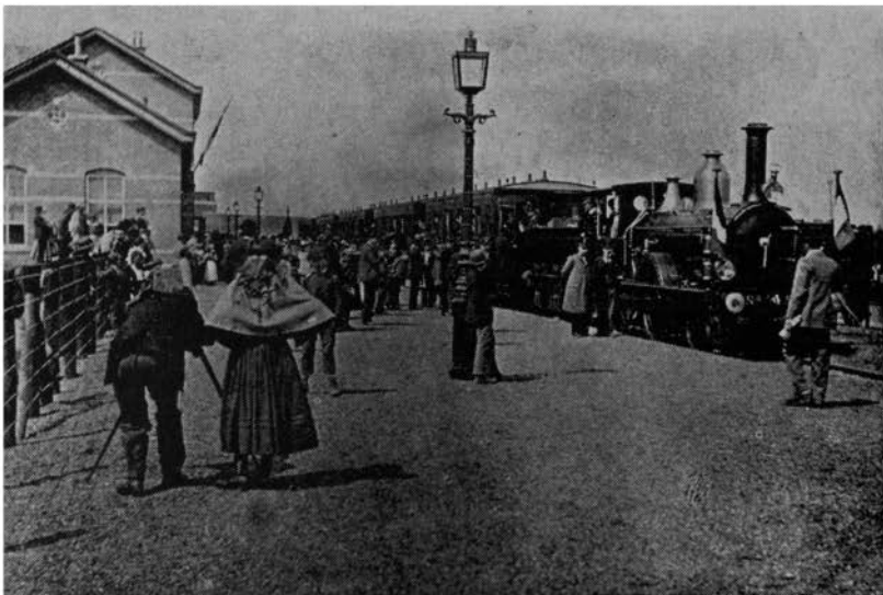
Aankomst van de eerste trein te Heerlen, 30 april 1896.

gen werden verricht, zowel van Belgische als van Duitse zijde, bleven de kansen tot verwezenlijking der bestaande plannen toch miniem en moest men nog lange tijd met de postwagen genoeg nemen.