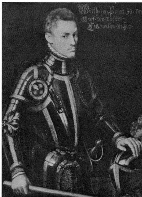
Willem van Oranje

Voor Willem van Oranje viel het dodelijke schot op 10 juli 1584 te Delft.