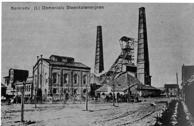
Afbeelding als prentbriefkaart van het fabriekscomplex van de Domaniale mijn omstreeks 1915.

tot geen resultaat mogt leiden alsdan zijne uitgaven voor reiskosten zullen vergoed worden”.