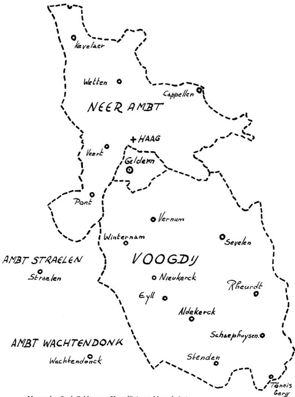
Neerambt, Stad Geldern en Voogdij (naar Nettessheim)