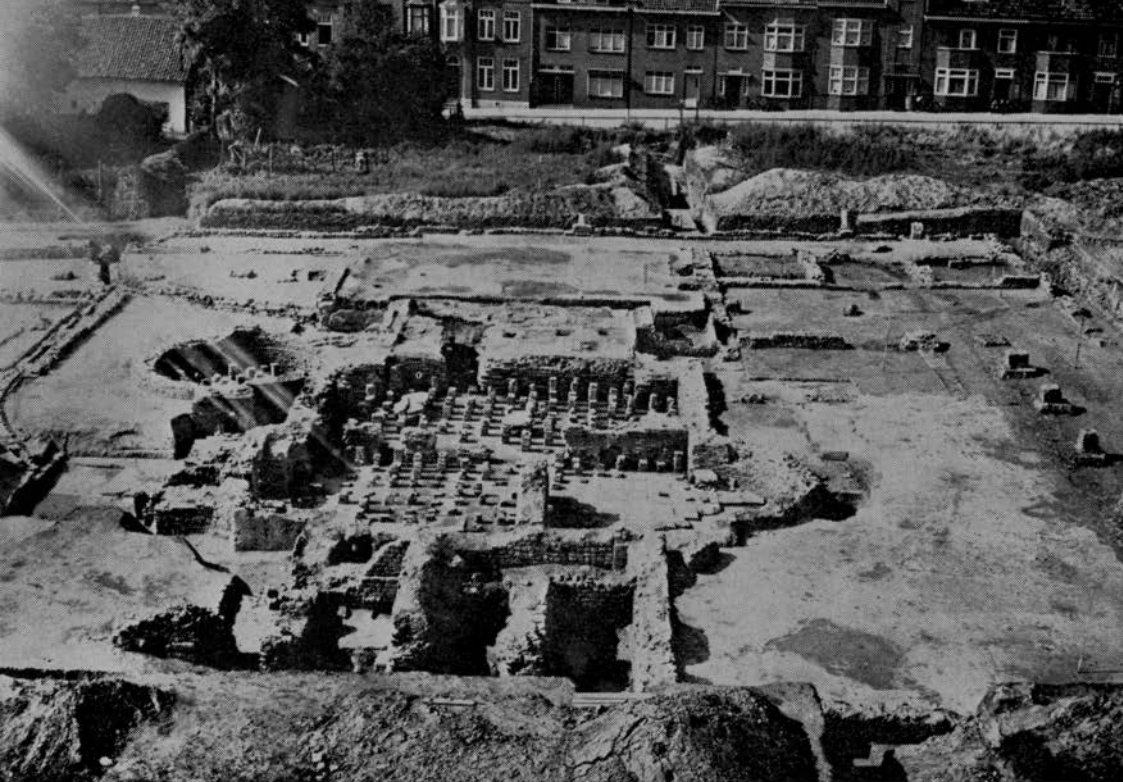
Overzicht van de opgegraven thermen in september 1941, gezien vanaf de huidige Deken Nicolaijestraat

museum zal bewerkstelligen, dat de confrontatie met dit historisch monument van volksgezondheid en recreatief karakter door talloos velen van nu en van de verre toekomst kan worden genoten. Heerlen kan nu zijn romeinse geloofsbrieven méér aansprekelijk maken, waardoor inschakeling bij de wetenschappelijke instituten en het internationale cultuur-toerisme bevorderd wordt. Het zal tevens bijdragen tot een meer gemotiveerd collectief historisch bewustzijn bij de Heerlenaar. Heerlen: een moderne stad, gebouwd op de fundamenten van de vicus Coriovallum.