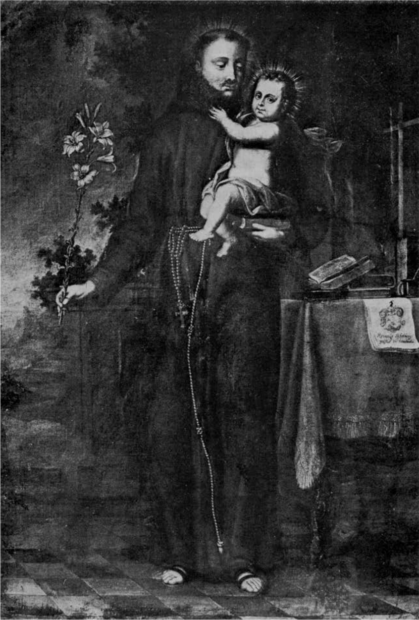
Het gerestaureerde schilderij van Sint Antonius van Padua in de Pancratiuskerk