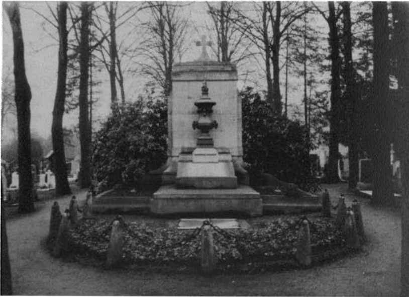
Het Belgische grafmonument op het kerkhof aan de Akerstraat te Heerlen

Op mijn vraag aan enkele Heerlenaren, of zij het Belgische monument op de begraafplaats aan de Akerstraat kenden, kreeg ik het laconieke antwoord, dat men dit natuurlijk wel kende, omdat het zo'n opvallende plaats inneemt dat geen enkele bezoeker van het kerkhof het over het hoofd kan zien. Over de oprichting en de betekenis is echter niet veel bekend. Gebruik makend van gegevens in het gemeente-archief wil ik het een en ander uit de vergetelheid terughalen. Het gaat immers om een monument, dat al meer dan 50 jaar in Heerlen staat.