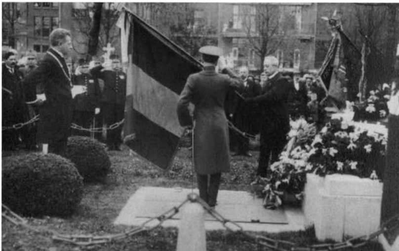
De onthulling van het Belgische grafmonument te Heerlen op 3 mei 1925