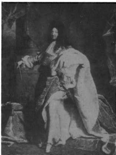
Lodewijk XIV, koning van Frankrijk van 1643 tot 1715. (schilderij van Hyacinthe Rigaud, Louvre Parijs; reproductie uit Grote Winkler Prins met toestemming van Elsevier).