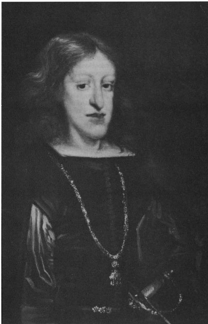
Karel II, koning van Spanje van 1665 tot 1700. (schilderij van Claudio Coello, Prado Madrid).