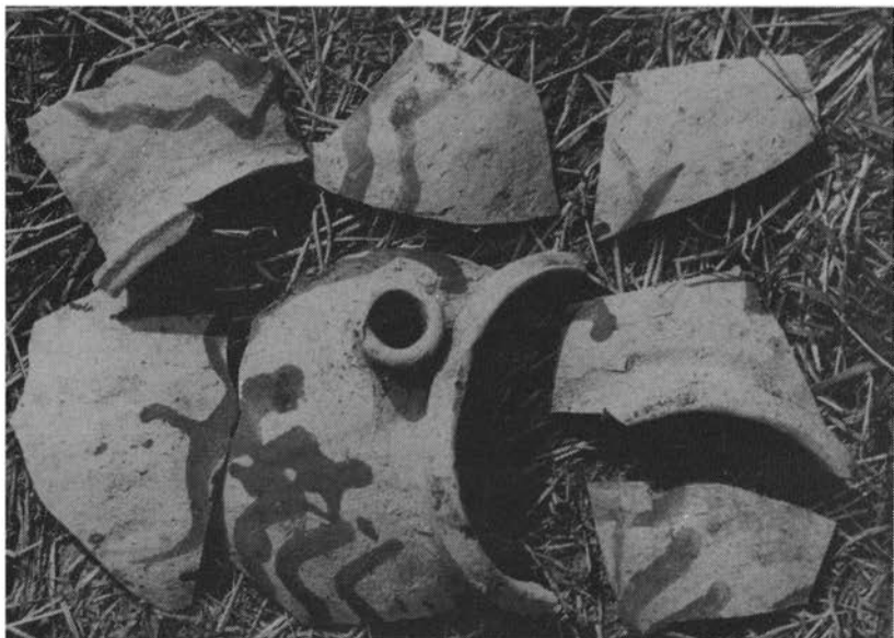
Tuitpot, gevonden in de oostelijke oven.

Ik wil hier nog aan toevoegen, dat er op 21 september 1977 weer andere pottenbakkersovens zijn blootgelegd en wel twee in de Gatenstraat en één aan de Heereweg in Nieuwenhagen. De ovens in de Gatenstraat kwamen aan het daglicht tengevolge van de vernieuwing van de riolering aldaar. Eén ervan leverde vier mooie volledige aardewerkprodukten op, waaronder een rammeelaar met het rammelsteentje er nog in. Ook hier werd de opgraving verricht onder leiding van de heer Bruijn. Volgens zijn mening dateren deze ovens uit ongeveer dezelfde tijd als die van de Groenstraat en de vroeger genoemde Nieuwenhaagse oven (eerste kwart 12-de eeuw).