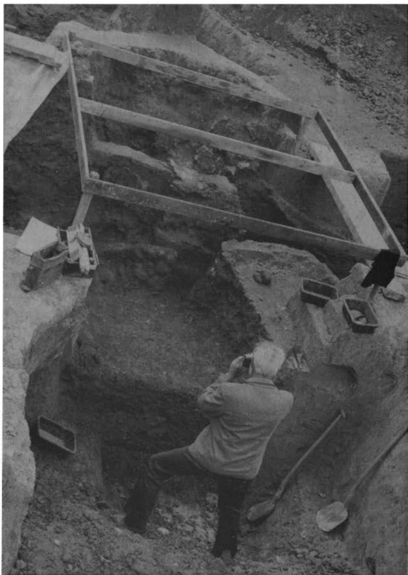
Gezicht op het centrale deel van het ovencomplex met meetraam. Vooraan de nog niet geheel leeggeruimde stookkuil van de noordelijke en oudste oven met houtskool en aslagen. Op de voorgrond de heer Bruijn.