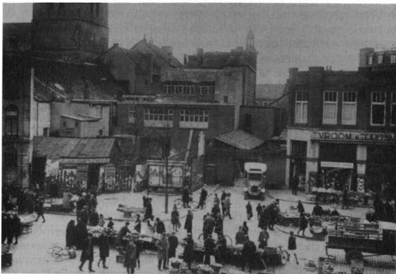
Markt op de Bongerd in Heerlen omstreeks 1930. Waar zich de huizen links bevinden, staat nu het glaspaleis.

De Middenstandsvereniging reageert snel en heftig. Men is om allerlei redenen tegen de instelling van de vrije markt, men zou zelfs graag zien dat de acht bestaande vrije markten afgeschaft zouden worden. Ook de Kamer van Koophandel reageert in deze zin, terwijl de Bond van Markthandelaren niets van zich laat horen.