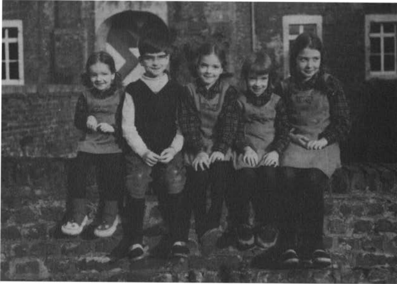
De eerste vijf van de zeven kinderen van de familie op kasteel Kellenberg.