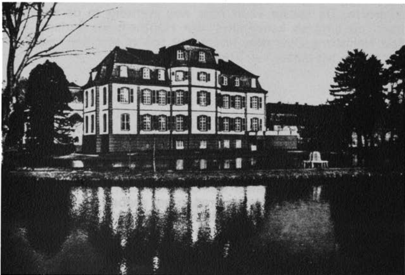
Hoofdgebouw van kasteel Türnich (westzijde). Toestand ca. 1935.

Na Hermans dood in 1454 werd zijn andere broer, Nicolaas, opvolger „als heer” en hij bleef dat tot in 1474. In diens linie zette zich de erfopvolging voort. Een eeuw later komen we dan terecht bij de toenmalige „heer”: Wolter Hoen (1543-1576), achterkleinzoon van genoemde Nicolaas, die ook al kinderloos overleed.