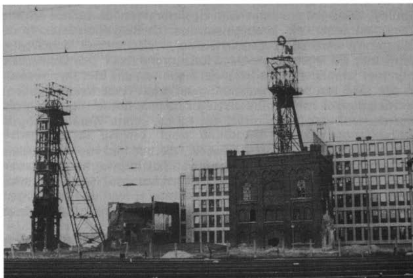
Het terrein van de Oranje Nassau-mijn aan de Kloosterweg met het restant van de mijn en de opdringende gebouwen van het Centraal Bureau voor de Statistiek. (Foto Dries Linssen, 1978).

mijn de naam Hendrik. De naam Maurits is vastgesteld bij koninklijk besluit van 1915, toen besloten werd de in 1911 en 1912 aangekochte Maasvelden te ontsluiten. Dat uitgesproken nationale namen gekozen werden in die jaren had betekenis in verband met het boven aangehaalde motief: het zich te weer stellen tegen Überfremdung. We leven dan in een tijd van sterk uitgesproken Pruisisch imperialisme. Pan-Germanen, Alduitschers, militaristen en leden van de Flottenverein vinden, dat in feite Nederland slechts bestaansrecht heeft als een integrerend deel van het „Grote Duitse Rijk“.