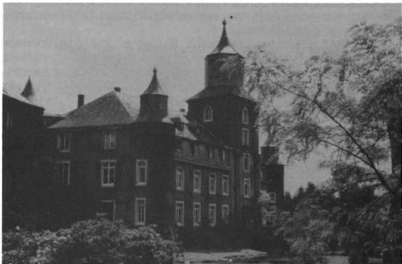
Kasteel Kellenberg (de oude burcht aan de Kalle).

waarbij de familienaam achtereenvolgens veranderde in „Van Hoensbroeck“, „Van en tot Hoensbroeck“ en nu, verduist, in „Von und zu Hoensbroech, treft men in opvolging stellig een aantal personen aan, omtrent wie in het familiearchief vele en interessante mededelingen zijn vastgelegd 8 . Enkele schrijvers hebben daarover al verslag gedaan 9 .