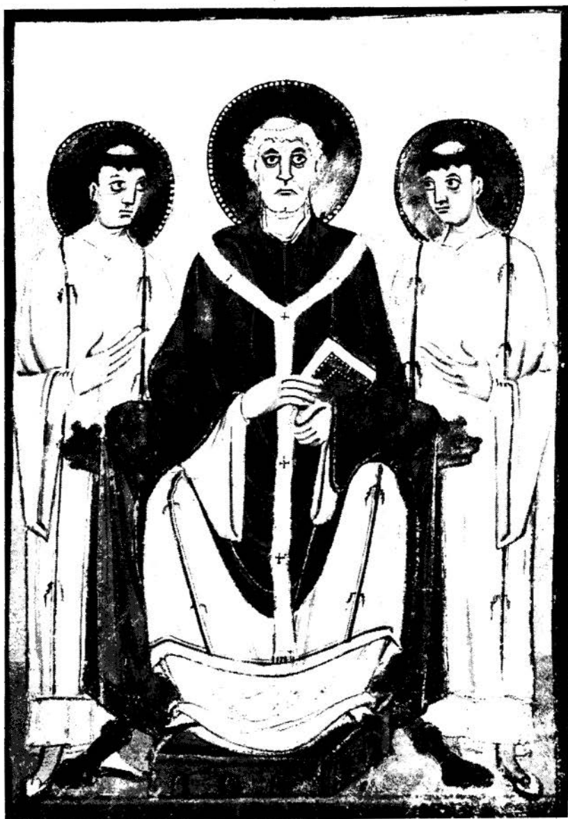
Sint Willibrord. (Miniatuur uit een graduale van de abdij van Echternach, 11-de eeuw).