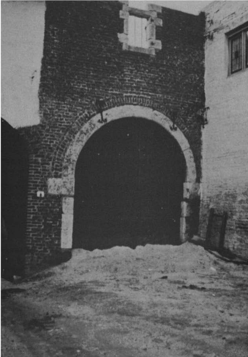
Poort met er boven een omlijst raam, enige jaren geleden door de OGON afgebroken. Dit was het restant van de „deftige” toegang tot het binnenplein toen alles nog één geheel was.