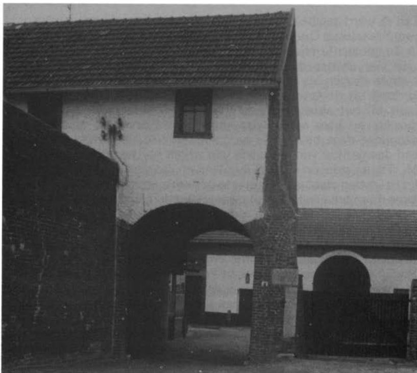
De poorten van de Heihoven aan de wegzijde. Links van het hek ziet men restanten van de oude „deftige” poort; rechts begint de scheidingsmuur.