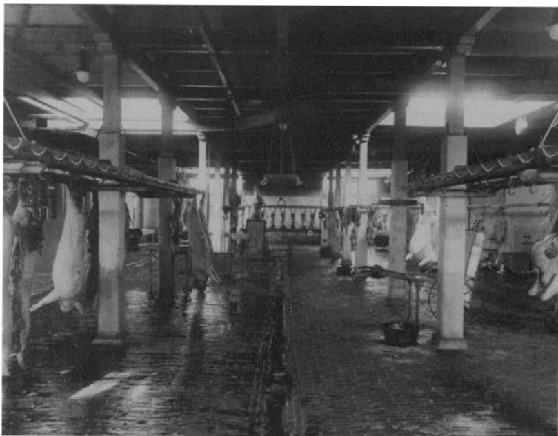
Slachthal van het noodslachthuis, ca. 1924.

de slecht geoutilleerde en onhygiënische particuliere slachtplaatsen. Dit verplicht gebruik is lange tijd een twistpunt geweest, dat uiteindelijk in 1901 resulteerde in een wijziging van artikel 4 van de Hinderwet, waardoor de gemeenten vrij waren het verplicht gebruik van de openbare slachthuizen te regelen 8 .