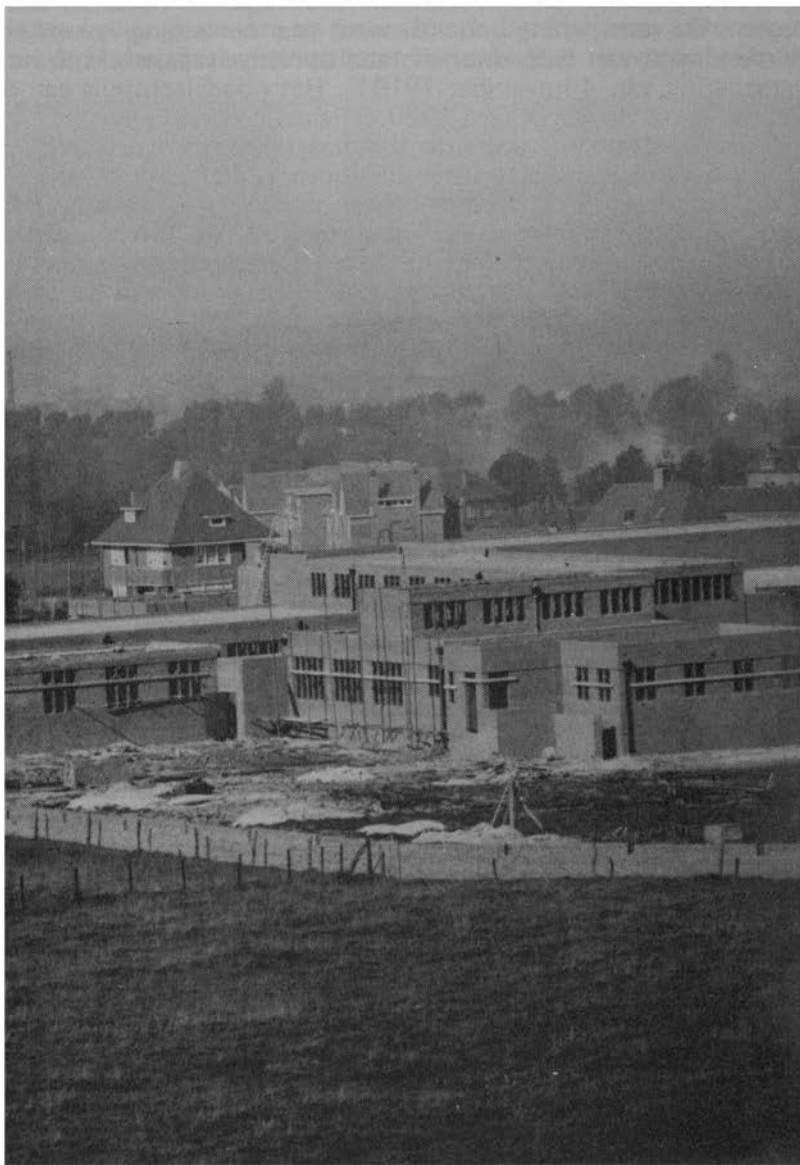
De varkensslachthallen in aanbouw, ca. 1928.