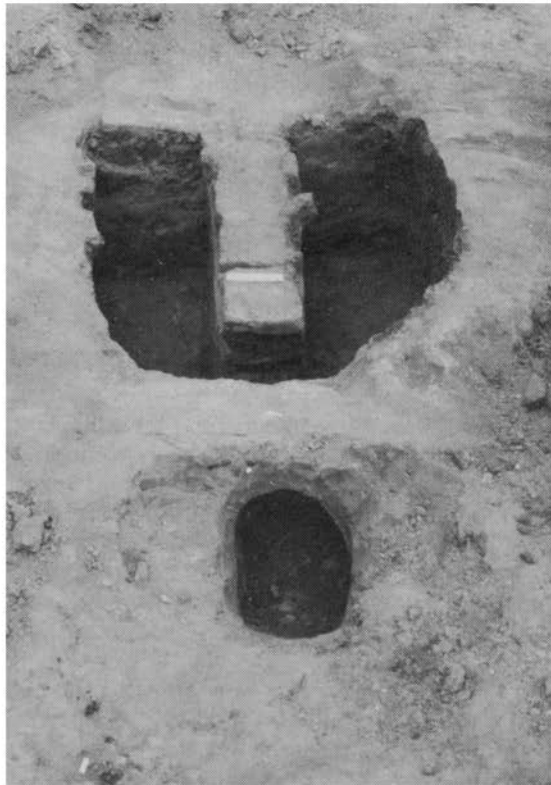
Overzicht van de uitgegraven oven. Op de voorgrond het stookgat, in het midden de tong.