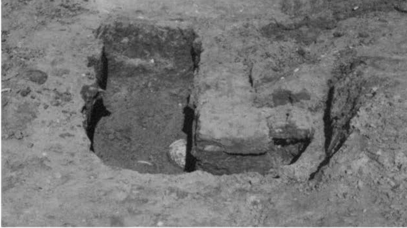
Gezicht op de stookruimte. In de linker stookgang is een welfpot in situ te zien; rechts fragmenten van het rooster boven de nog niet uitgegraven rechter stookgang.