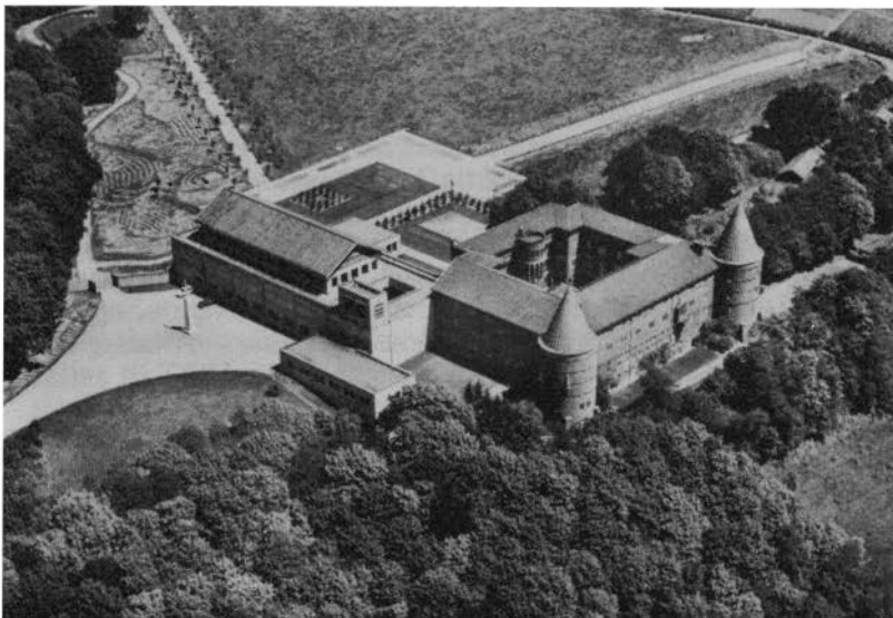
Abdy Sint Benedictusberg te Vaals.

ken hadden in dat Brabantse stadje hun klooster gebouwd in 1906 (dus 13 jaar na de Merkelbeekse stichting van 1893) en heel veel Nederlandse roepingen getrokken, zodat men in 1935 zelfs een stichting had kunnen ondernemen in Egmond, welke in 1947 zelfstandig zou worden. Bovendien had het groeiend aantal roepingen eind 1945 een nieuwe stichting, de Slangenburg bij Doetinchem, noodzakelijk gemaakt, maar deze zou nog veel krachten vergen. Toen Rome nu voorstelde dat de Oosterhoutse abdy de Sint Benedictusberg van Mamelis weer nieuw leven in zou blazen, stond de toenmalige abt voor een moeilijke beslissing. Terecht vroeg hij zich af, of er niet te veel van zijn abdy werd gevegd. Toch is besloten op het voorstel van de Romeinse instanties in te gaan, mits men vijf jaren uitstel kreeg. Zo kwam Mamelis onder de hoede van een derde Benedictijner-congregatie.