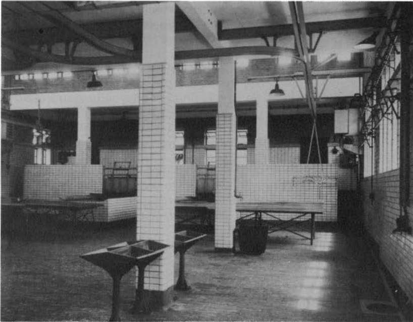
Interieur van het slachthuis, ca. 1929.

toekomst in de directe omgeving van het slachthuis woningbouw verwachtte. Volgens de directeur was een modern ingericht slachthuis absoluut reukloos. Bovendien waren de terreinen al eigendom van de gemeente en behoeftte de belangrijkste aanvoerweg (Voskuilenweg) slechts verbeterd en verbreed te worden. Op 30