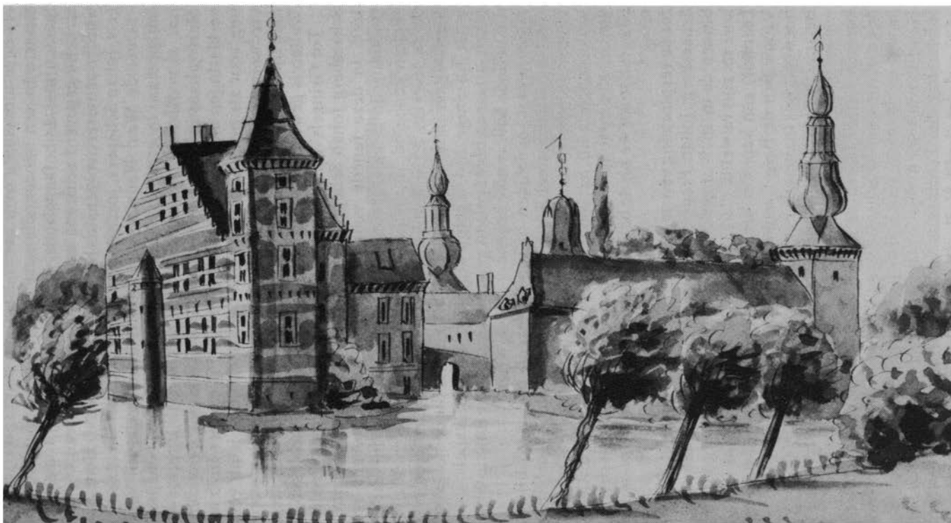
Kasteel Schaesberg omstreeks 1850, tekening van Ph.G.J. van Gulpen. Origineel: Gemeentelijke Archiefdienst Maastricht, Album Van Gulpen I, blz. 84.