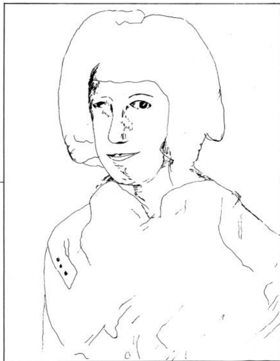
Een tekening van hetgeen P. Delnoy nog ziet van het portret van de vrouw.