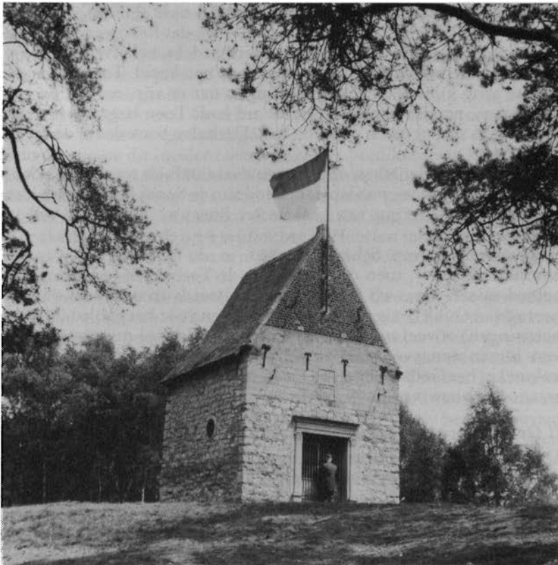
De kapel van Onze Lieve Vrouw van de berg Carmel bij Leenhof.

Flos Carmeli, vitis florifera, Splendor coeli, virgo puerpera Singularis, Mater mitis, sed viri nescia, Carmelitis da privilegia, Stella maris 24 .