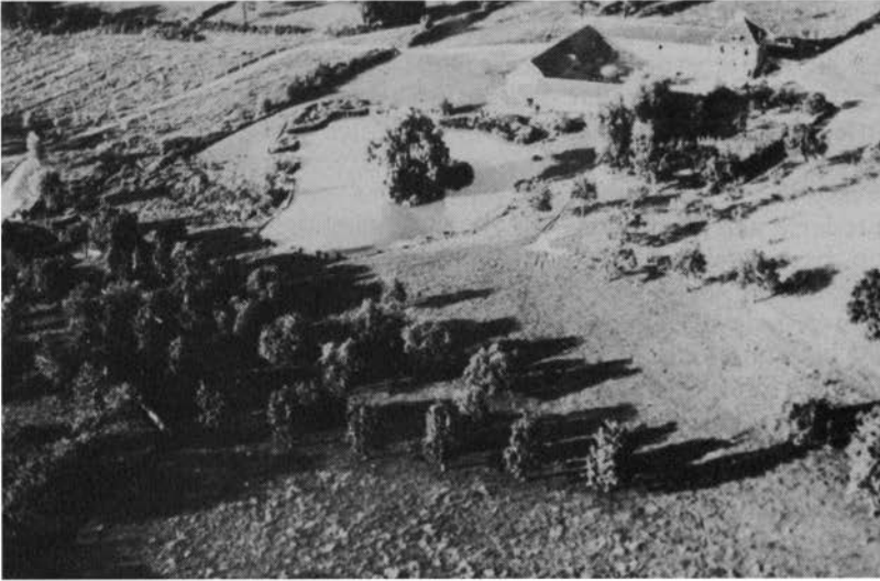
Luchtfoto van hoeve Benzenrade. Het Blokhuis zou op het eiland in de vijver gestaan hebben.