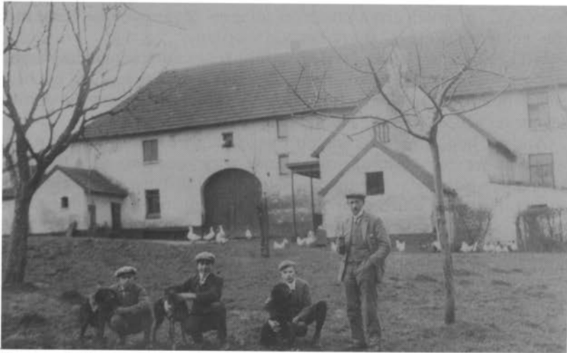
De voorzijde van de Brughof, anno 1923.