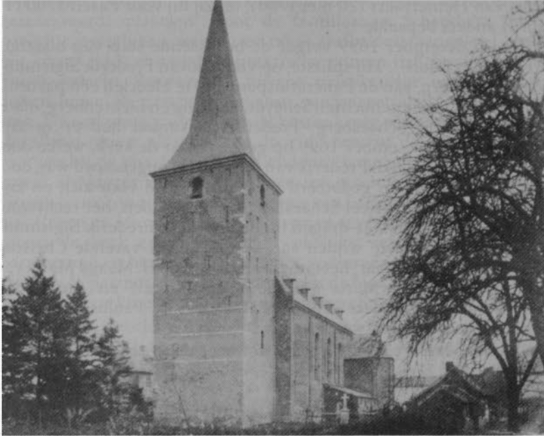
De Petrus- en Pauluskerk te Schaesberg zoals ze van 1699 tot in 1914 bestond.