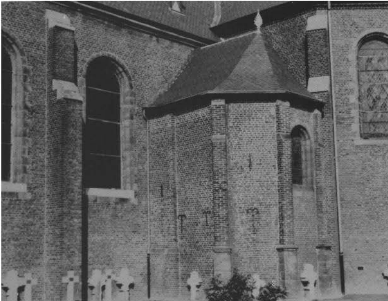
Zuidzijde van de kerk met de in 1698-1699 gebouwde zijkapel (midden) en de in 1914-1916 gebouwde dwarsbeuk (rechts).