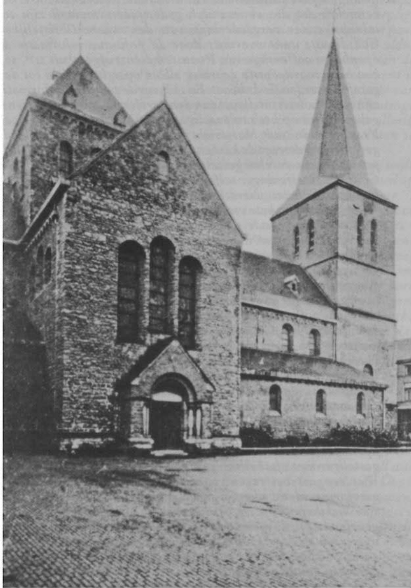
De noordzijde van de Pancratiuskerk, gezien vanaf het Kerkplein. Oudere opname uit de twintiger jaren.