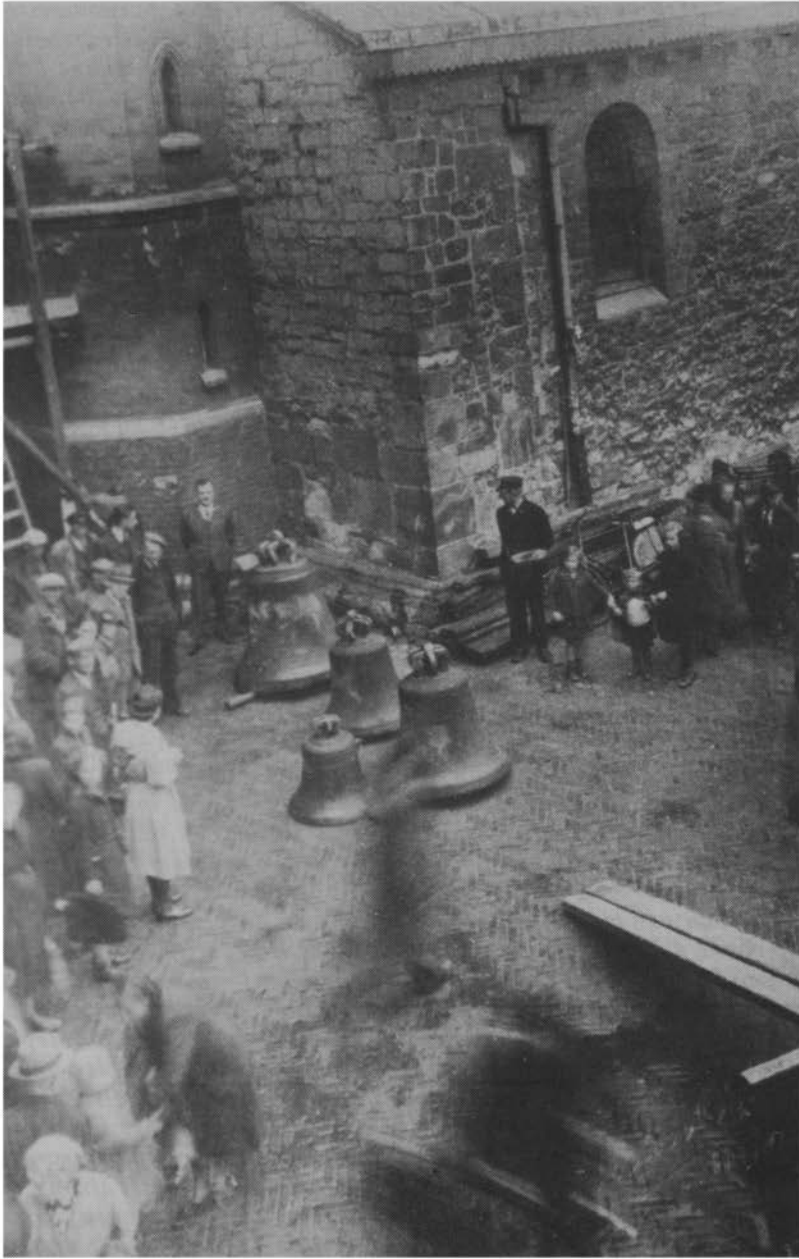
De klokken van de Pancratiuskerk werden door de Duitsers geroofd. Na de oorlog kwamen er vier nieuwe, die de namen Pancratius, Hubertus, Jozef en Maria ontvingen (december 1946).