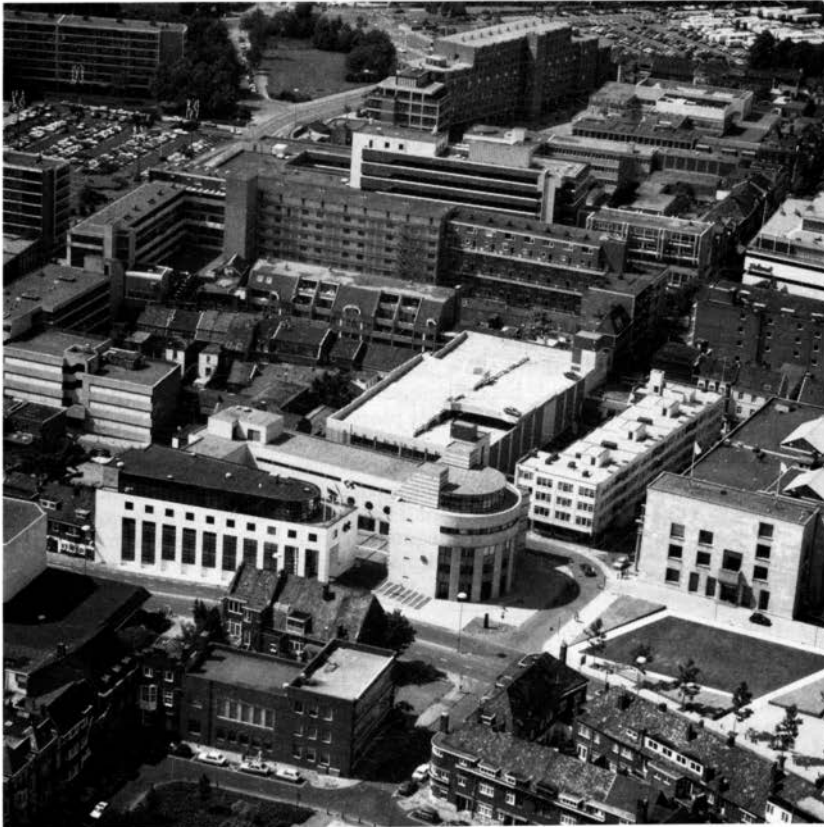
Het raadhuis met stijlvolle nieuwbouw; zicht op Promenade II. Foto uit 1988.

Tegenover de uniformiteit van het exterieur stond een grotere keuzemogelijkheid in woningtypen: naast de eengezinswoning voegden zich de maisonnette, de etagewoning, de 2-op-1-woning enz. Hoogbouw deed zijn intrede, eerst in bescheiden hoogte van drie of vier woonverdiepingen op een benedenlaag. Een vroeg voorbeeld is de Gringel, beambtenwoningen gebouwd door de O.N.-mijnen in 1949. Omstreeks 1960 besloot men de liftgrens in de woningbouw te overschrijden: flatgebouwen van zes en meer