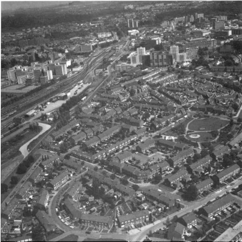
Eikenderveld, huizengroepen van verschillende perioden. Foto uit 1988.

Vanaf 7 april tot en met 10 juni loopt in het Thermenmuseum de tentoonstelling "Heerlen in vogelvlucht". Ongeveer 70 luchtfoto's uit de periode 1950-1990 willen een beeld geven van de verspreid liggende woonwijken en van het stadscentrum. De nadruk ligt op de architectuur uit verschillende tijden en op het decoratieve samenspel van huizengroepen en het stratenpatroon.