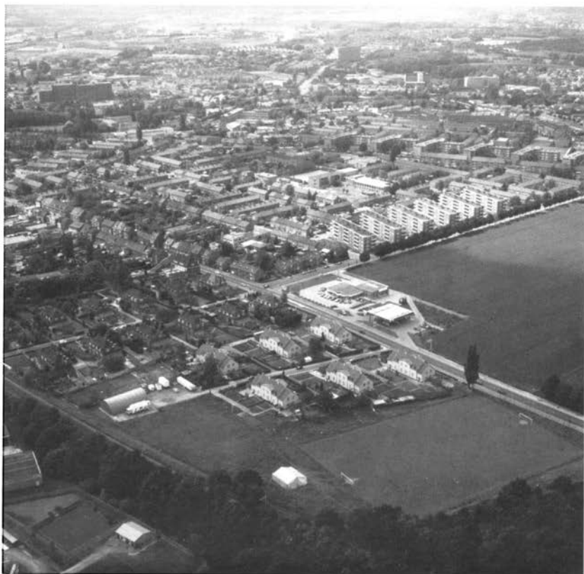
Kolonie Leenhof en het naoorlogse Schaesbergerveld. Foto uit 1988.

Met de mijnen nam de werkgelegenheid enorm toe. Duizenden mensen uit heel het land en uit het buitenland trokken naar de mijnstreek, maar velen bleven slechts korte tijd, afgeschrikt door het