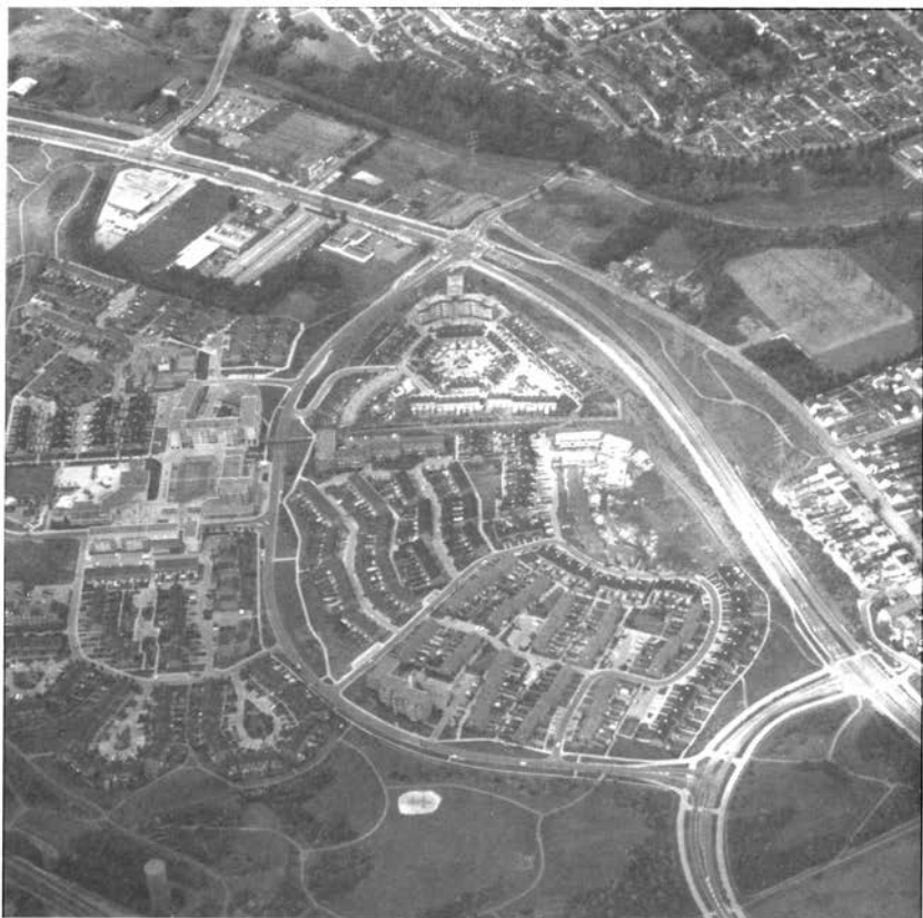
Zeswegen, een decoratief stratenpatroon. Foto uit 1988.

Na de Tweede Wereldoorlog was woningnood een nationaal probleem. De overheid subsidieerde goedkope en vooral snel te realiseren woningbouw. Zij stimuleerde experimentele bouwmethoden zoals prefabrikatie, de massale productie van bouwonderdelen voor woningen met een uniforme vormgeving. Bouwondernemingen en woningverenigingen waren afhankelijk van de overheids subsidies. De architect moest zich aanpassen aan de eisen van de opdrachtgevers. De stedenbouwkundige afdeling beoogde het aanbrengen van variatie en levendigheid in de onderlinge ordening van huizenblokken, straten en pleinen 19 .