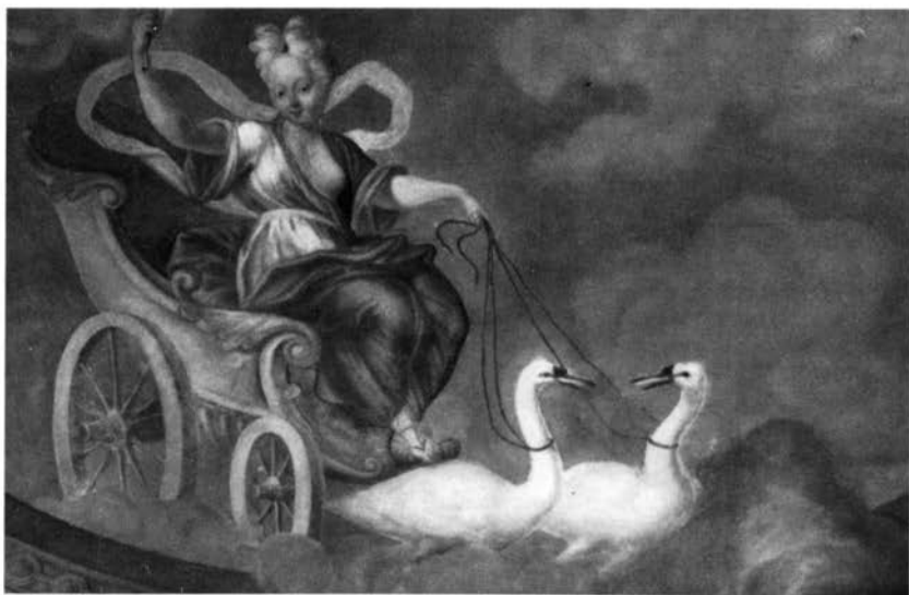
Plafondschildering "Int Eetsael" van kasteel Hoensbroek: de godin van de jacht -Diana- op een zegewagen, getrokken door twee zwanen.