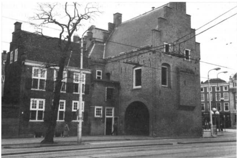
De Gevangenpoort in Den Haag, waar Smeets en de joden van Voerendaal gevangen zaten.