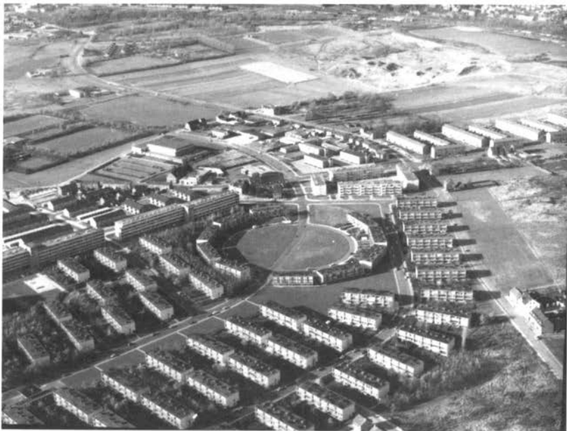
De Stack, Unescoplein, de "fantasierijke satellietstad". Foto uit 1974.