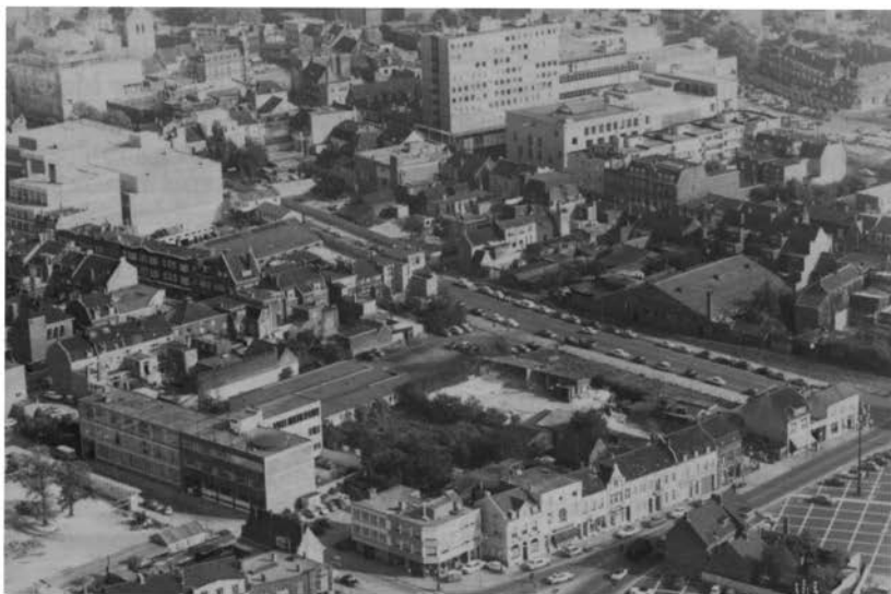
De Geerstraat, vóór de aanleg van Promenade II. Foto uit 1962.

zware werk 3 . De woningnood groeide intussen uit tot een zeer ernstig probleem, dat met bezorgdheid werd gadeslagen door de katholieke geestelijkheid. Soms zelfstandig, maar vaak in nauwe samenwerking, stampten mijnondernemingen en woningverenigingen, gecentraliseerd in “Ons Limburg” (opgericht in 1911 door Mgr. dr. H. Poels) 4 hele wijken tegelijk uit de grond. In deze periode ontstond de onregelmatige, verbrokkelde opbouw van de gemeente.