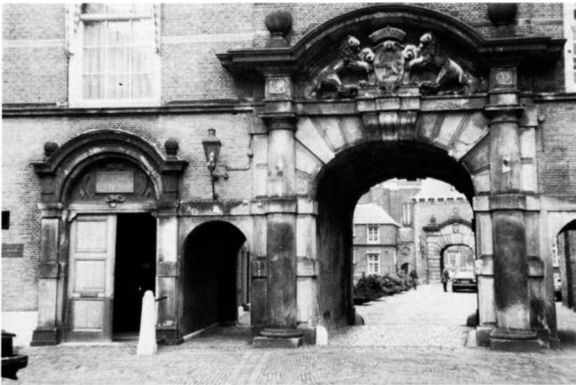
Aan het Binnenhof in Den Haag. De deur links gaf toegang tot de vergaderruimte van de Raad van Brabant.

In 1648 bepaalden de verdragsluitende partijen in art.3 van het Munsterse vredesverdrag: "Wat aangaat de drie kwartieren van Overmase, te weten: Valkenburg, Dalhem en 's-Hertogenrade, zullen deselve blijven in den staat, zoals zij zijn, en in geval van dispuut en controversie, zal deselve verzonden worden aan de