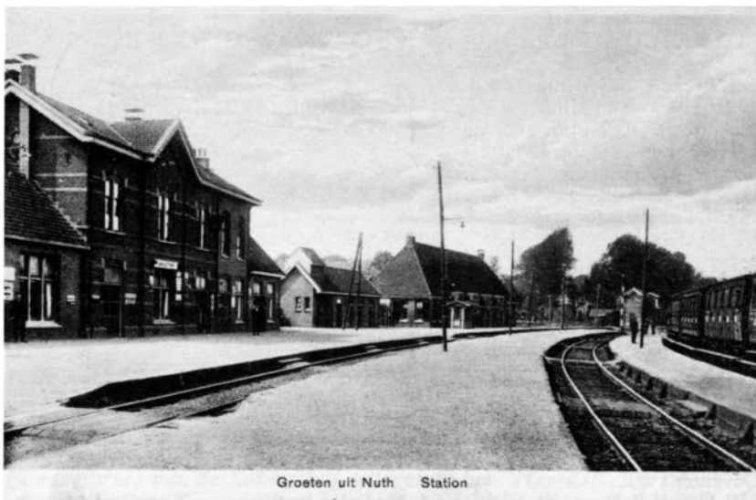
Het station van Nuth (prentbriefkaart uit de collectie van J.P.J. Engelen, Klimmen).

Niettemin is de Zuider-Spoorwegmaatschappij toch enige jaren later geliquideerd. In de overeenkomst met de Staatsspoorwegen over de exploitatie was nl. een bepaling opgenomen dat de Staatsspoorwegen de spoorweg ieder moment konden kopen. En in 1898 maakten zij bekend dat zij dat per 1 januari 1899 wilden doen. Daarmee kwam een eind aan de Nederlandsche Zuider-Spoorwegmaatschappij, die alleen de lijn Herzogenrath-Heerlen-Sittard heeft weten te realiseren. Haar ander plan - een kortere verbinding tussen Sittard en Eindhoven (via Weert) - heeft zij niet kunnen voltooien.