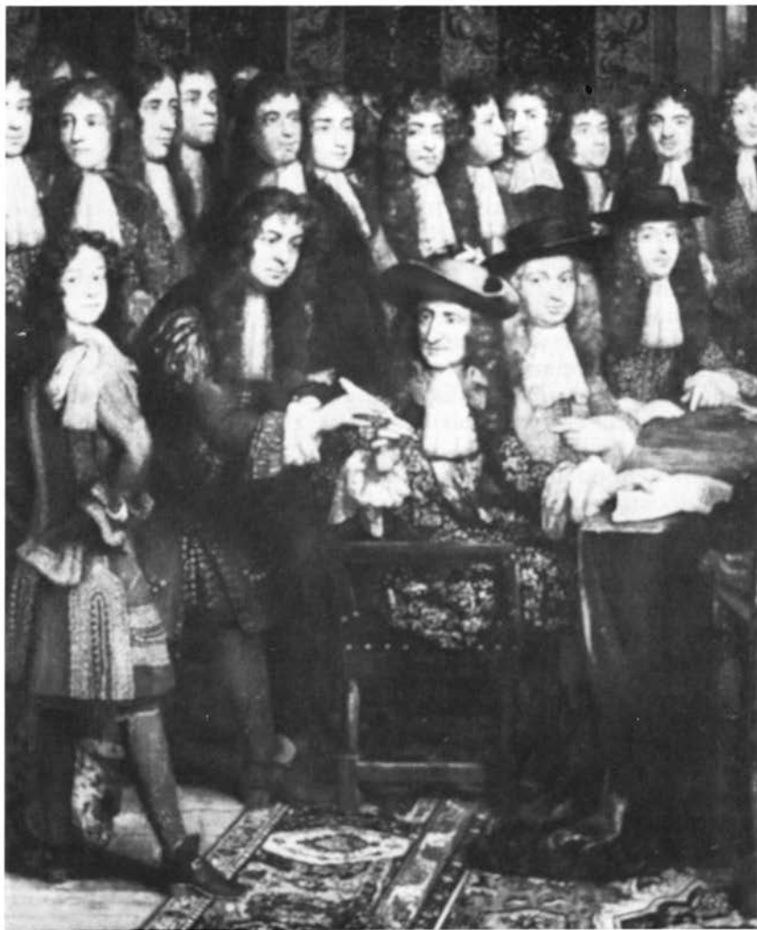
Maarschalk d' Estrades ontvangt de pen om het vredesverdrag met Spanje te ondertekenen.

De betreffende acte liet nog enige tijd op zich wachten. Er kwam zelfs via de al genoemde Jehan Lamoureux nog een request uit Turijn binnen met de wat ongeduldige vraag waar het stuk bleef 32 . Op 27 september was het eindelijk zover dat het kon worden verzonden 33 . Misschien had de aanmaning toch zijn werk gedaan. Op 8 oktober kan abt d'Estrades ook in naam van de begunstigde Jean de Groussou zijn dank betuigen aan de heren in Den Haag 34 . De overdracht van het personaatschap in Heerlen was inderdaad tot volle tevredenheid geregeld.