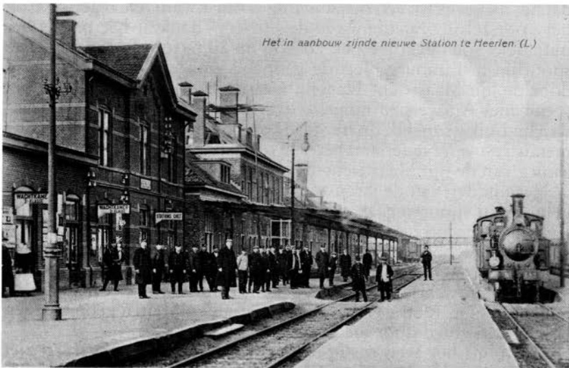
Het station van Heerlen voor de eerste verbouwing in 1912.

Zoals we nu weten zijn de plannen niet doorgegaan; in 1871 had de Luiker-Maastrichtse Spoorwegmaatschappij het plan een spoorlijn aan te leggen van Maastricht over Heerlen naar Geilenkirchen. De maatschappij vroeg bij de regering concessie aan voor deze lijn en de gemeenteraad van Heerlen besloot deze aanvraag te ondersteunen, waarbij men naar voren bracht dat "de bloei van landbouw en nijverheid hoofdzakelijk afhangt van goedkope en snelle middelen van vervoer" en dat de streek zonder spoorlijn niet die ontwikkeling zou doormaken als wanneer men wel een spoorlijn had.