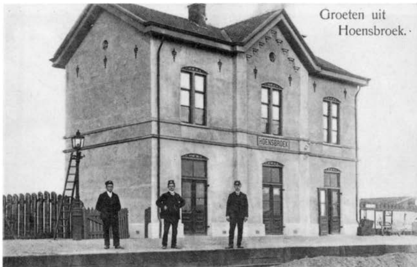
Het station van Hoensbroek uit circa 1910 (prentbriefkaart uit de collectie van J.P.J. Engelen, Klimmen).

Hij vestigde zich op 18 maart 1887 in Heerlen en startte met het