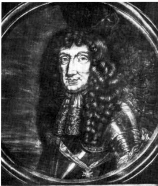
Portrait of Godefroy Comte d'Estrades, Marshal of France, in military uniform. The text below the portrait is a handwritten inscription in French, likely a dedication or a note related to the portrait.

Of aan de vicaris-generaal het recht tot deze benoeming werkelijk toekwam is zeer twijfelachtig. Het was hooguit de bevoegdheid van de bisschop van Roermond of diens plaatsvervanger aan de benoemde persona de institutio canonica te verlenen en vooral de