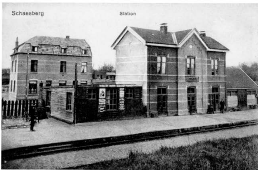
Het station van Schaesberg. Dit is het enige station dat momenteel nog in zijn oude gedaante bestaat (prentbriefkaart uit de collectie van J. P. J. Engelen, Klimmen).

De exploitatie van de lijn werd verzorgd door de Maatschappij tot exploitatie van Staatsspoorwegen. De onderhandelingen over de voorwaarden werden in oktober 1890 reeds afgesloten. Beide par-