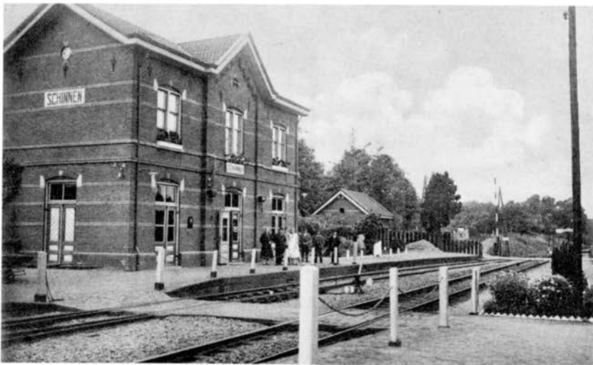
Het station van Schinnen (prentbriefkaart uit de collectie van J.P.J. Engelen, Klimmen).

Op 1 juni 1888 werd de concessie door hem aangevraagd en op 24 mei 1889 door de minister verleend, voor het gedeelte op Nederlands grondgebied. Voor het Duitse gedeelte moest hij concessie aanvragen bij de Pruisische minister van Openbare Werken, die ook toestemming moest verlenen voor het medegebruik van het station te Herzogenrath.