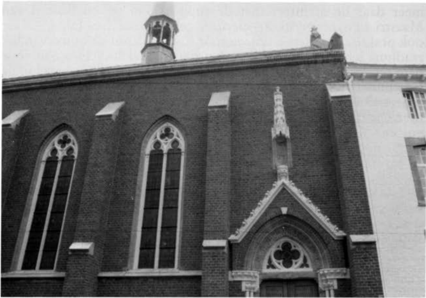
Afb. 6. De kapel van het Savelbergklooster: terracotta profielsteen in de daklijst en de vensterlijsten. De traceringen in de vensters zijn klassiek gotisch.