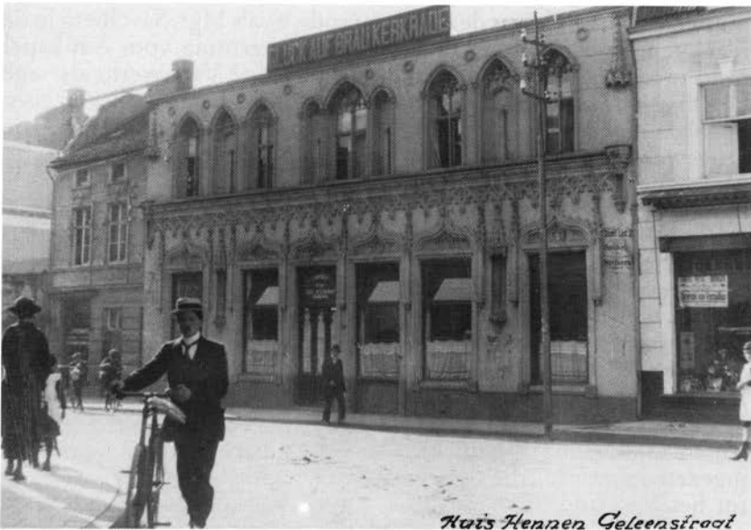
Huis Hennen Geleenstraat

Afb. 5. Het inmiddels verdwenen Huis Hennen aan de Geleenstraat.