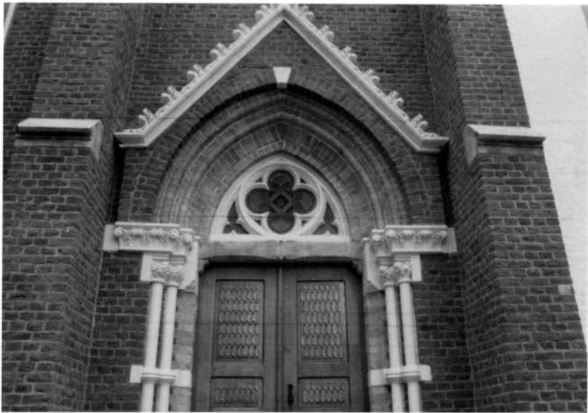
Afb. 7. De kapel van het Savelbergklooster: terracotta profielsteen in de archivolt.