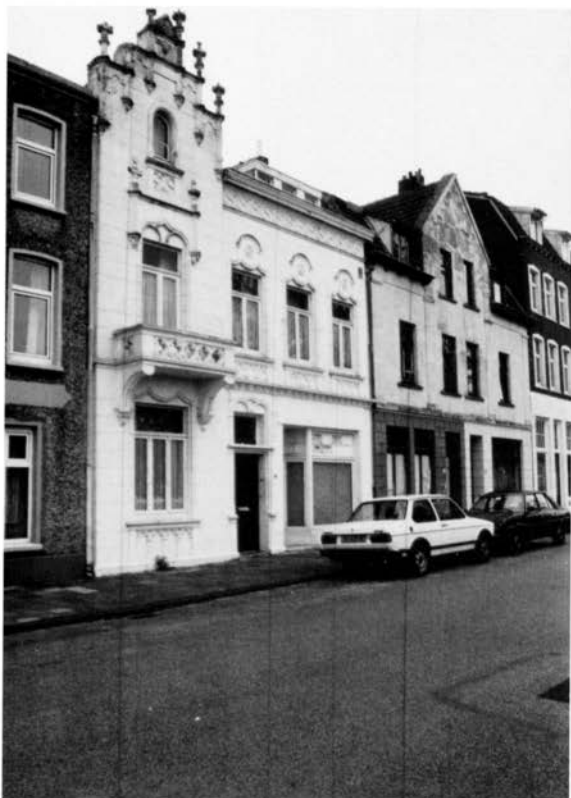
Afb. 3. Pand Sittarderweg 50.

onlangs heeft ondergaan bracht echter elementen onder de aandacht die opnieuw vragen oproepen. Met name het gebruik van klassiek gotische vormtaal in de venstertraceringen en het gebruik van terracotta-profielstenen in vensterlijsten, daklijst en in de archivolts tussen deuren en wimberg vielen na de schoonmaak door de kleur weer in het oog. 7 De eerste vraag die - althans bij mij - spontaan opkwam, is wie de architect van de kapel was. De beantwoording van die vraag zal ik beginnen met een stelling: "Om verschillende, hieronder te beschrijven redenen is de architect van de kapel zeer waarschijnlijk dezelfde als de architect van het niet meer bestaande, eerste raadhuis van Heerlen (1878-1941), namelijk Johannes Kaijser (1842-1917)". 8 Ik moet hier zeggen 'zeer waarschijnlijk' omdat noch in de literatuur, noch in de archieven, noch in de eigentijdse lokale periodiek (de Limburger Courier), de naam van de architect van de kapel expliciet te achterhalen is.