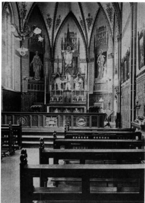
Afb. 9. De kapel van het Savelbergklooster (1878-1879), Gast- huisstraat 45.