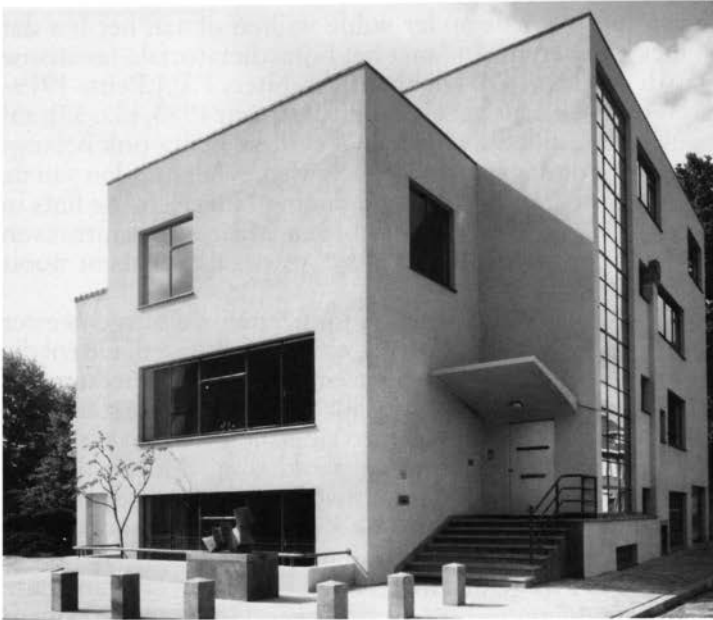
Huis Op de Linde in geresatureerde vorm.

echter bijna niet in het oog vallen o.a. door het gebruik van een pilaster, waarop het beeld De Bokkerijder van Charles Vos rust. De ramen liggen in één vlak en toch wijkt een gedeelte van de gevel richting voordeur iets terug. De vensterbank van het raam naast de Bokkerijder kent daardoor een teruglopende lijn.