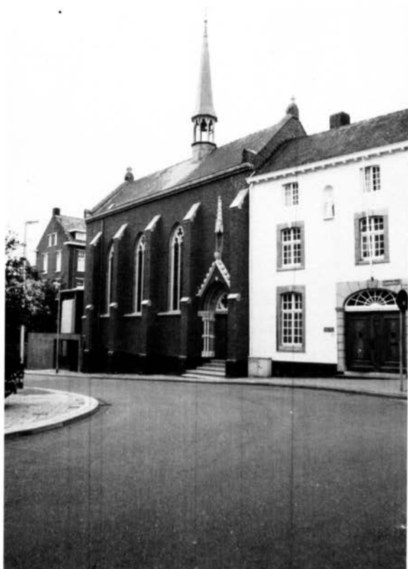
Afb. 1. De kapel van het Savelbergklooster (1878-1879), Gast- huisstraat 2.

de Huis Hennen aan de Geleenstraat, op de plaats ongeveer waar tegenwoordig de kledingzaak Wibra is gehuisvest en dat in de jaren twintig reeds werd gesloopt (zie afb. 3, 4 en 5).