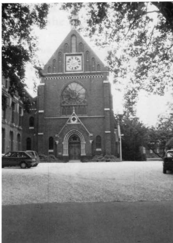
Afb. 2. De kapel van Huis de Berg (1919-1920), Gasthuisstraat 45.