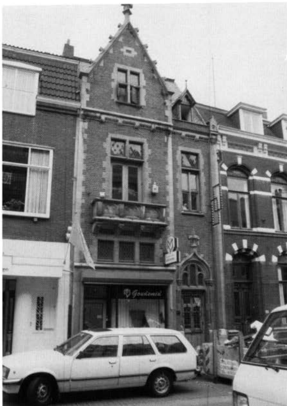
Afb. 4. Pand Geleenstraat 55.