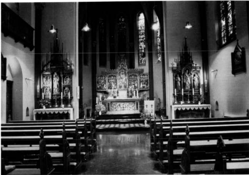
Afb. 8. Het verdwenen interieur van de kapel van het Savelbergklooster.

moeilijk te zeggen. Opvallend is wel het kleurverschil van de profielsteen, wat op het temperatuurverschil van de veldbrandoven kan wijzen. Ik denk echter dat de steen niet lokaal gebakken is, maar geleverd door een in profielsteen gespecialiseerd bedrijf. In elk geval maakte geen enkele architect in de kerkebouw in Limburg bij het exterieur tot 1880 gebruik van gekleurde steen. De veelgeprezen Cuypers maakt pas vanaf 1884 gebruik van terracotta bij het exterieur van zijn kerken. 34 Dus ook dit verwijst het eerst naar Kaijser. Daarmee zou de kapel van het Savelbergklooster een vroeg voorbeeld kunnen zijn van een gebruik van terracotta-profielsteen in de neogotiek van Kaijser. Een ander element is het gebruik van de dakruiter. Kaijser maakte hier graag gebruik van, zelfs bij profane gebouwen als bijvoorbeeld het raadhuis van Heerlen.