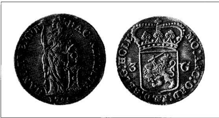
Een Hollands drieguldenstuk uit 1795. Het omschrift op de voorzijde is: "Hac nitimur, hanc tuemur". Dit betekent: Op haar (de Nederlandse Maagd) steunen wij, haar beschermen wij.

Men trof aan "In een komood van eiken en ander hout, geel geverwd, met drie laden en een lessenaar in eene kamer op de eerste verdieping, uitzicht hebbende op den misthof en in den tuin" :