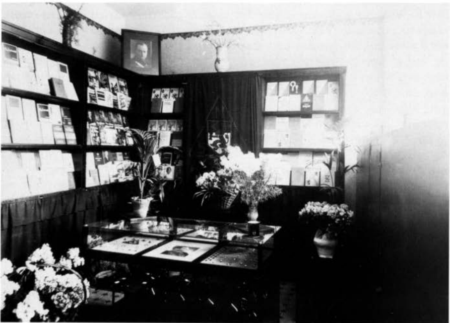
Interieur van De klimmende Leeuw.