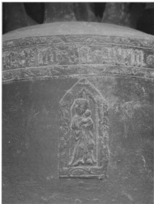
De kerkklok van 1414 met opschrift en Mariamedaillon.

De replica is vervaardigd door Jos. Porankiewicz en Remi van der Linden. De werkwijze was als volgt. Alvorens tot het gieten over te gaan moest er een gietvorm worden gemaakt. 3 Daartoe werd met hele fijne klei een afdruk gemaakt van het origineel op de klok zelf. De klei werd daarbij aan de achterzijde bestreken met een laagje gips om te verhinderen dat de negatieve kleiafdruk zou bre-