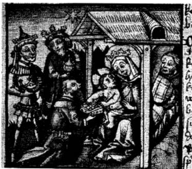
Uit een handschrift van de abdij Lichtenthal, ca. 1460, Karlsruhe, Badische Landesbibliothek.