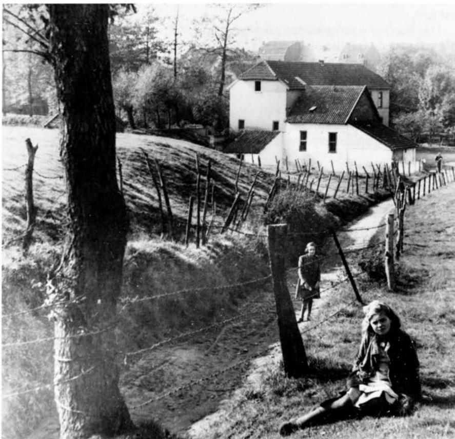
De Schandelermolen rond 1930.

J.H. Deumens, de laatste molenaar die de Schandelermolen bemaalde, hoopt dat de gemeente binnen enkele maanden met een positief bericht komt. Hij verwacht, uit verschillende subsidiepotjes, zo'n 42.000 gulden te krijgen. De resterende 28.000 gulden moet de familie zelf betalen.