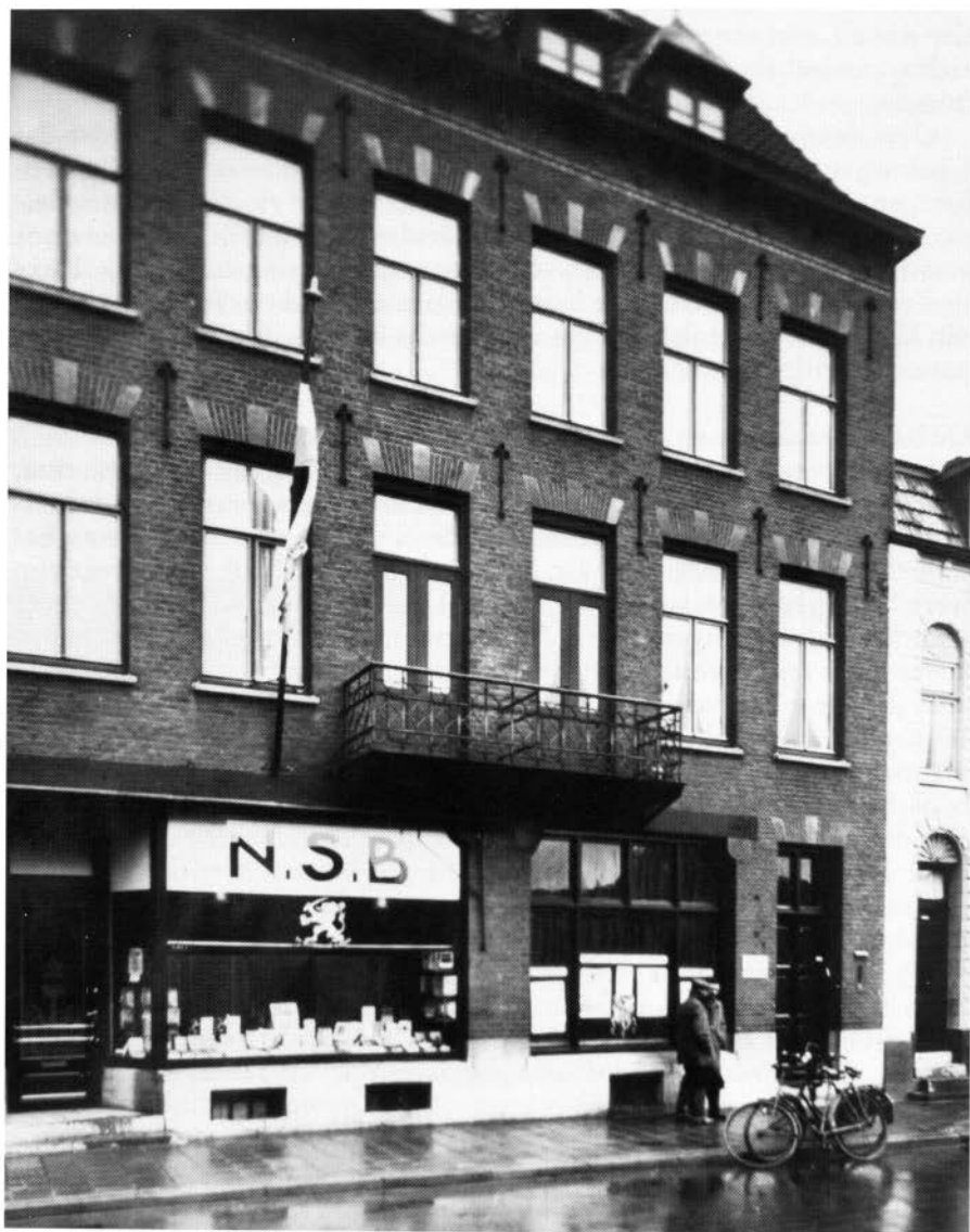
Boekhandel De Klimmende Leeuw annex Kringhuis van de NSB-kring Mijnstreek aan de Honigmanstraat te Heerlen.

goed mogelijk dat De Klimmende Leeuw een groot deel van Limburg bestreken heeft. Bovendien was de NSB in zekere zin aangewezen op de eigen boekhandel, althans in Limburg. De fascistische lectuur werd in de reguliere boekhandel namelijk systematisch geweerd. 8