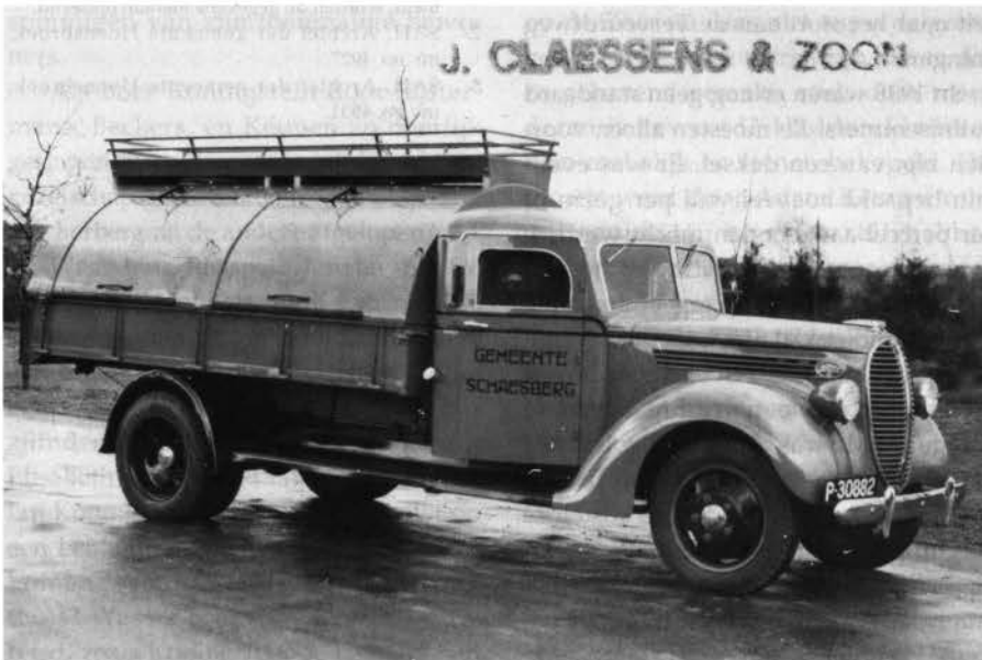
*Vuilniswagen van de gemeente Schaesberg.

In dat jaar breidde de gemeente Hoensbroek haar dienstverlening uit. Men ging in de verschillende wijken het vuilnis ophalen op een bepaalde dag in de week. Een caféhouder aan de Heisterberg diende al spoedig een klacht in. Bij hem werden de mosselschelpen namelijk niet meegenomen. De gemeente Hoensbroek antwoordde dat in het mosselseizoen (november) karrevrachten mosselschelpen werden aangeboden.