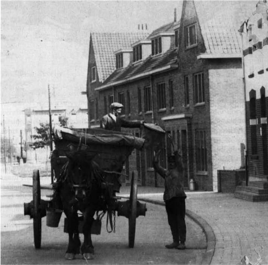
Vuilnis ophalen met paard en wagen op de Benzenrader in 1932.

Voorzien van minicontainers gaan we het begin van de 21e eeuw tegemoet. Gescheiden inzamelen van afval moet een betere verwerking en hergebruik van materialen mogelijk maken. Naast het terugdringen van de afvalstroom moeten dure voorzieningen als composteringsinstallaties, verbrandingsovens en van ondoordringbare bodems en