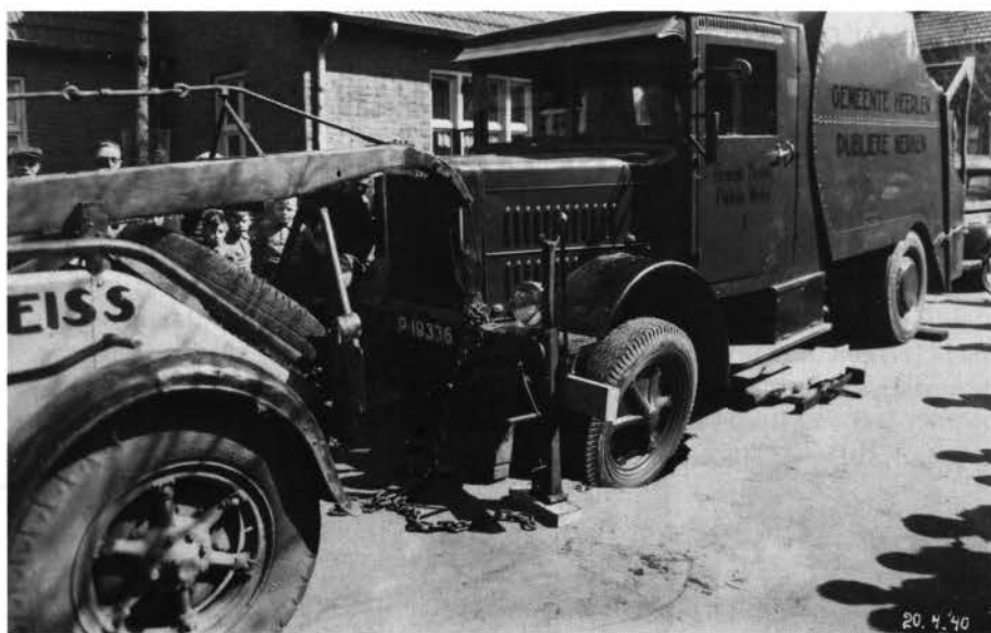
Vuilniswagen van de gemeente Heerlen door het wegdek gezakt.