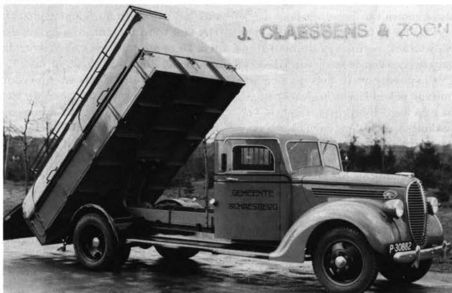
*Vuilniswagen van de gemeente Schaesberg.

Hoensbroekenaren (of mijnwerkers) waren blijkbaar liefhebbers van mosselen. De caféhouder moest, conform het antwoord van de gemeente, de schelpen zelf naar het stort aan de Terveurdtweg brengen. 3