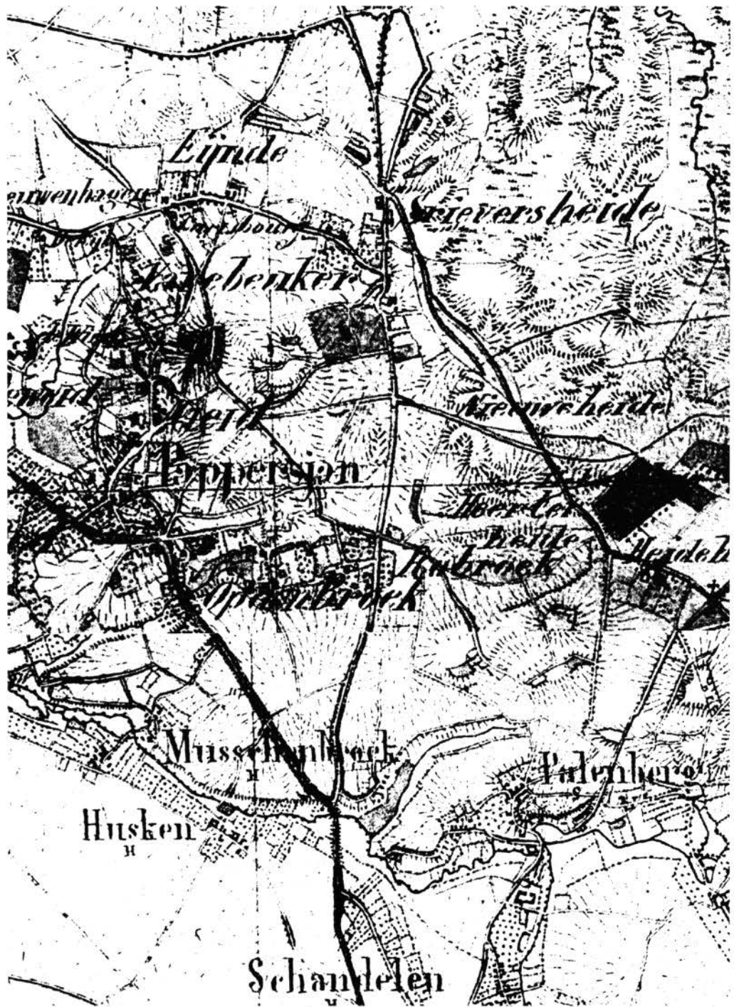
Heerlerheide en omgeving omstreeks 1840