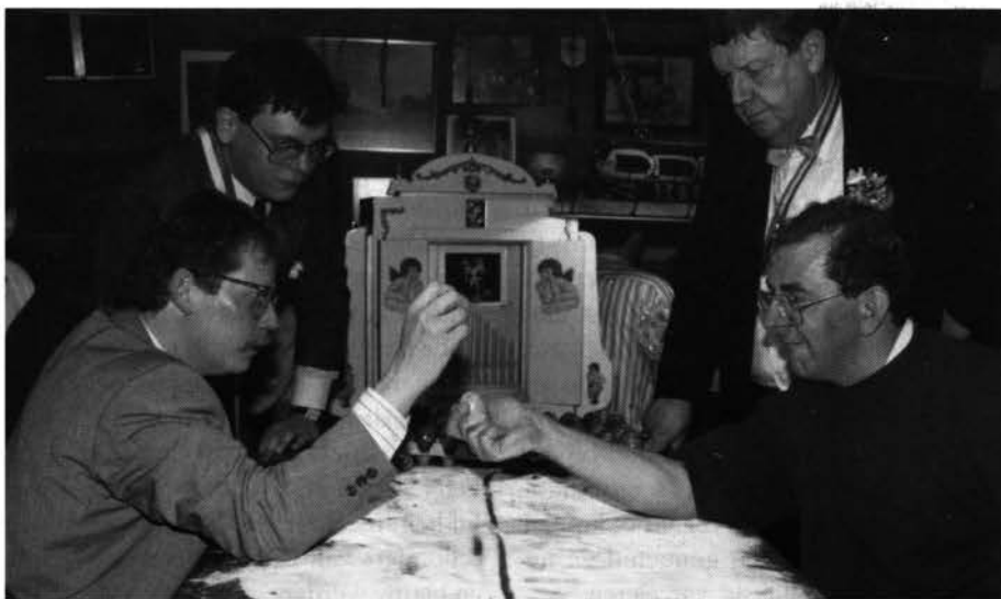
'Eier-tietsje' in Welten anno 1993.