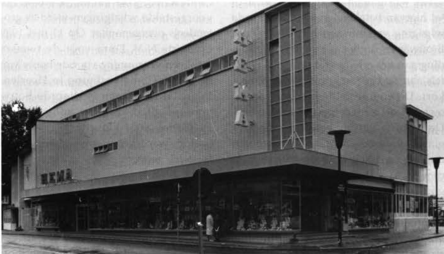
De Hema na de verbouwing van 1960 gezien vanaf het Raadhuisplein.