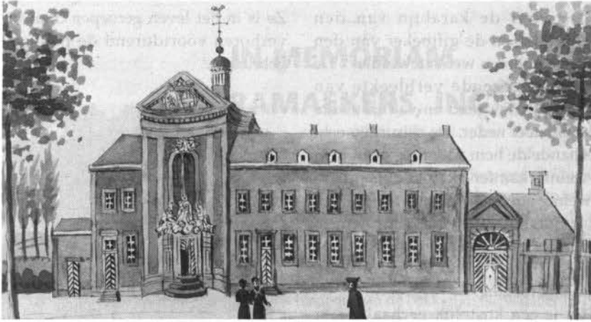
Het achttiende eeuwse Capucijnenklooster te Wittem, sinds 1836 bewoond door de paters Redemptoristen

ven den armen P.P. Capucijnen ten Wittem als geschenk toe. Zouden de Bokkenrijders dus niet met regt als voorgangers van de Democraten en Communisten onzer eeuw kunnen beschouwd worden.'