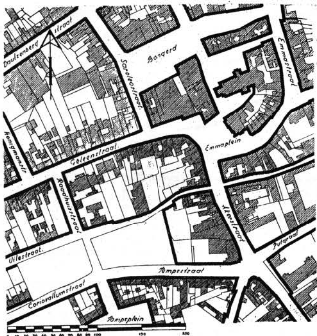
VOORHEEN Bovenstaand kaartje geeft een beeld van den toestand zooals deze was, voordat de doorbraak met alles wat er aan vast zat een feit was.