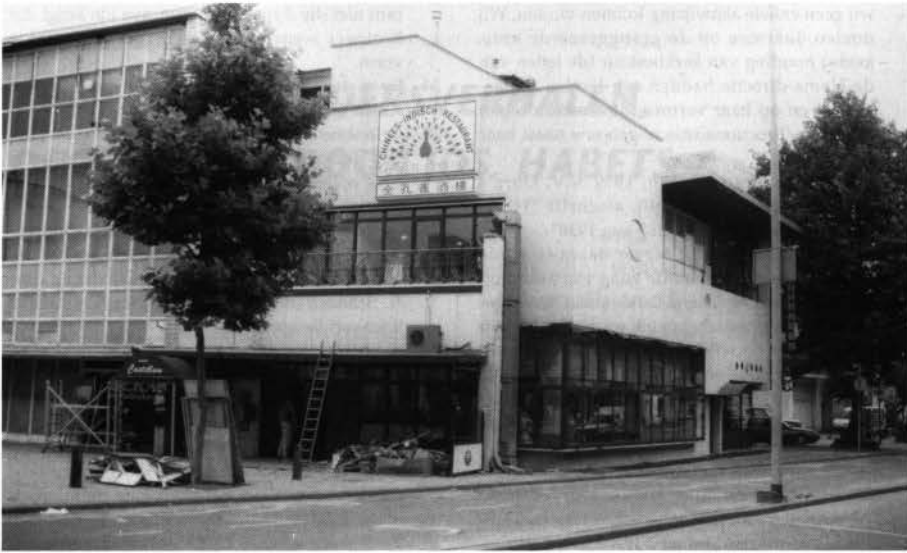
Plaatsing kunststofkozijnen in voormalig café-restaurant Castellum, Raadhuisplein 8.

gemeentelijke monumentennota snel door de raad dient te worden geaccordeerd. Zonder deze nota is de architectuur, waar Heerlen over het algemeen trots op is, overgeleverd aan de 'goede wil' van eigenaren en architecten.