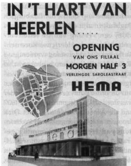
Affiche opening van de Hema in 1940.

In de Heerlense binnenstad is de laatste eeuw veel veranderd. Één van de opmerkelijkste wijzigingen, zowel visueel als historisch, hield verband met de bouw van de eerste Hema-vestiging in Heerlen. Oorspronkelijk was dit winkel-pand op het Emmaplein voorzien. Uiteindelijk opende de Hema in Heerlen voor het eerst haar deuren in een nieuw gebouw op de hoek van de Verlengde Saroleastraat (nu Dr. Poelsstraat) en de Uilestraat (nu Uilegats-Raadhuisplein). Door de bouw van het warenhuis op deze locatie, in 1939, kreeg het centrum een heel nieuw aanzien. De Saroleastraat werd verlengd en er ontstonden twee volwaardige pleinen: het Emma-plein en het Raadhuisplein.