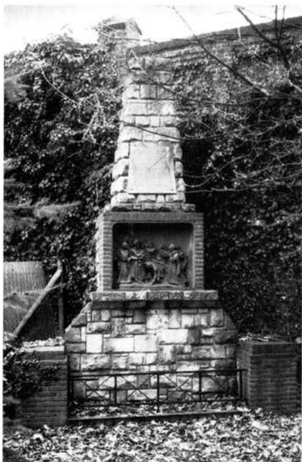
Statie 9 met de bronzen herinneringsplaquette