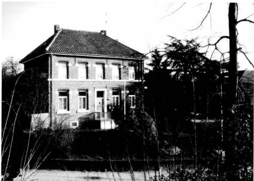
De kapelanie aan de Waubacherweg, in 1989 gefotografeerd vanaf de kerkheuvel van Eyselshoven.