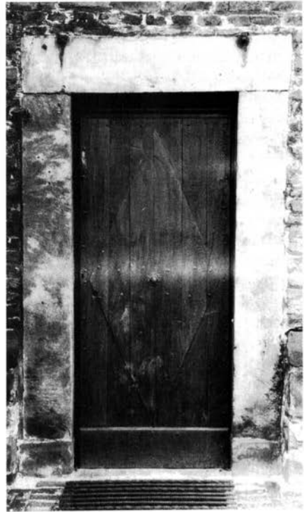
Zij-ingang van Johannes de Doper te Eygelshoven, met zandstenen omlijsting.