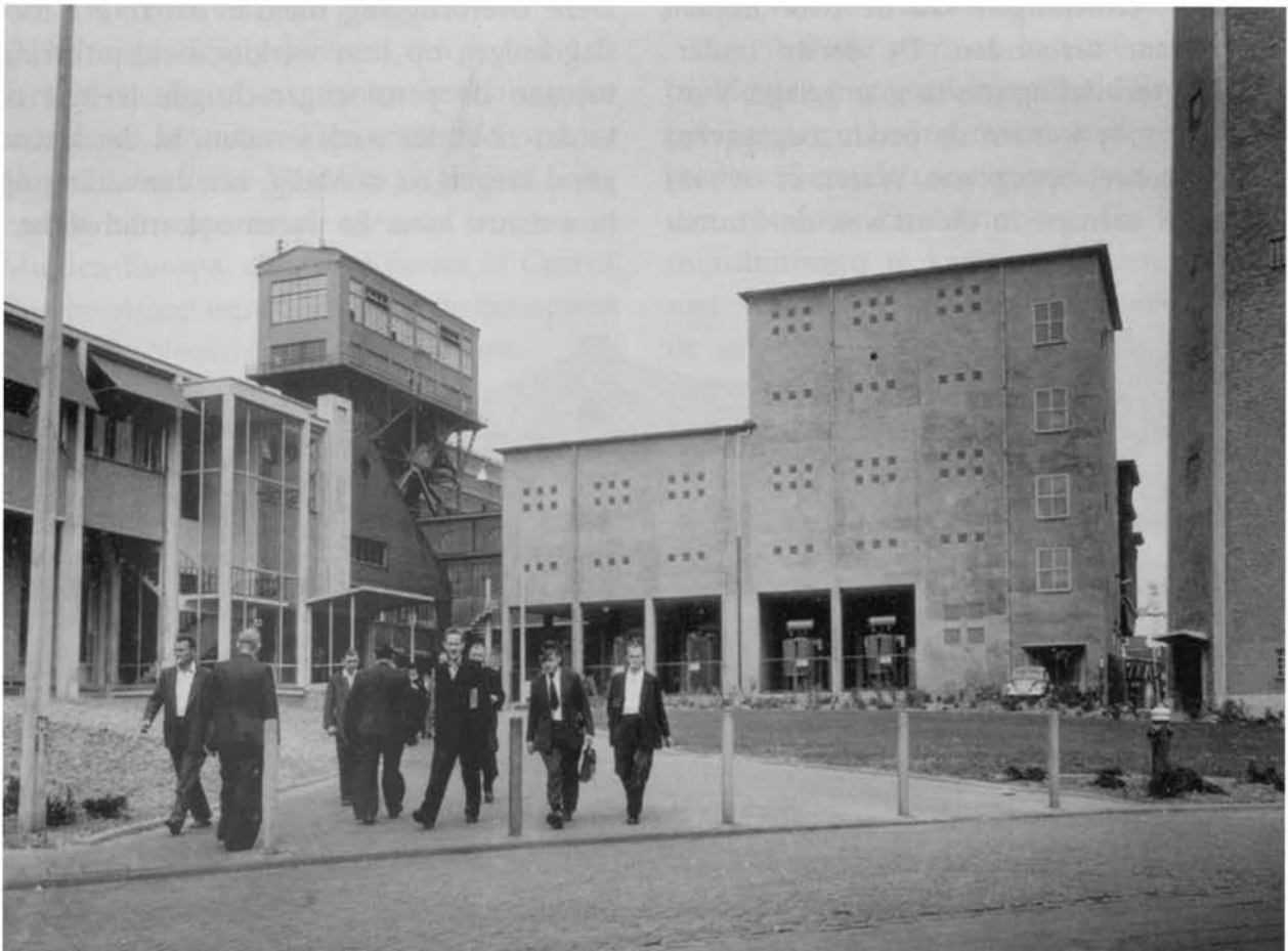
Mijnwerkers verlaten de schachtgebouw van de Staatsmijn Hendrik.