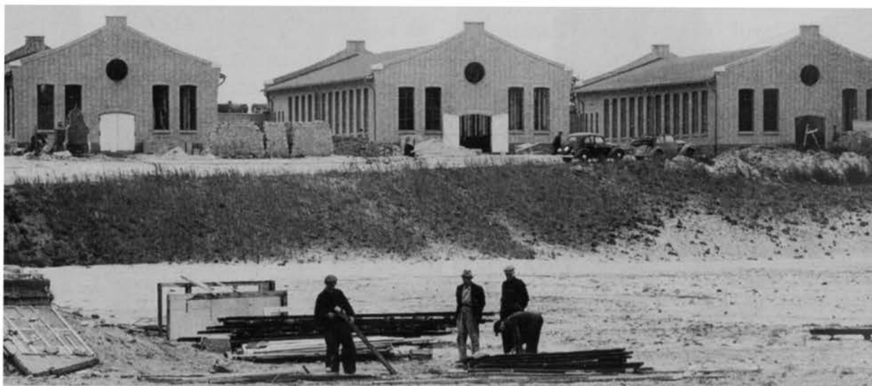
Een vroege foto van de opleidingsgebouwen van de Ondergrondse Vakschool [OVS] en de Technische Vakschool [TVS] van de Staatsmijn Hendrik aan de Venweg te Brunssum. Deze zijn vanaf begin jaren zeventig in gebruik van de Afcent, later Afnorth.

Voor de oudere werknemers, die bij hun vertrek maximaal vijf jaren vóór hun pensioen stonden, kwam een speciale regeling. Deze 'overbrugging' hield in dat zij een toeslag kregen op hun werkloosheidsuitkering tot aan de pensioengerechtigde leeftijd of totdat ze ander werk vonden. In dat laatste geval kregen ze, zonodig, een aanvulling op hun nieuw loon. Er waren ook mijnwerkers