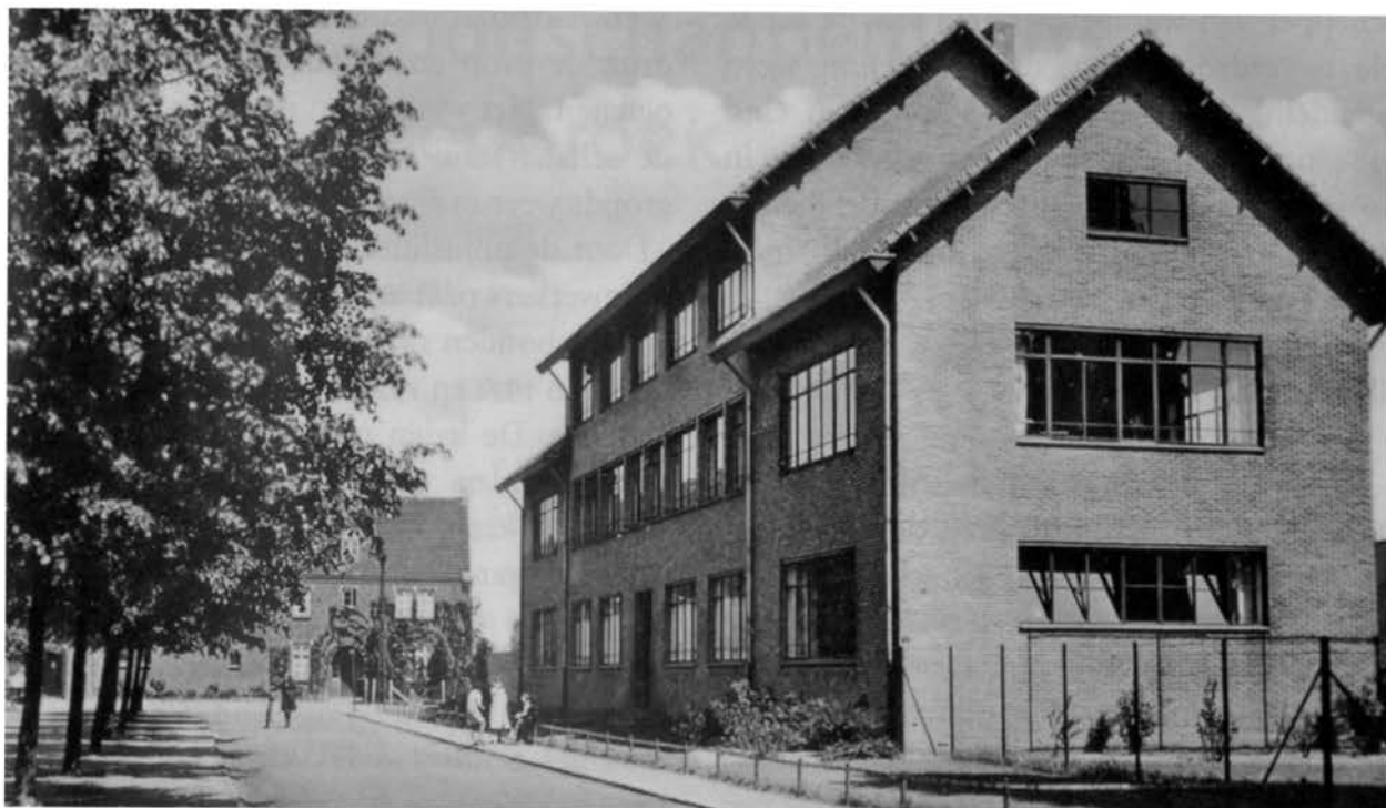
De R.K. Huishoudschool te Treebeek, waar mijnwerkersvrouwen cursussen konden volgen.