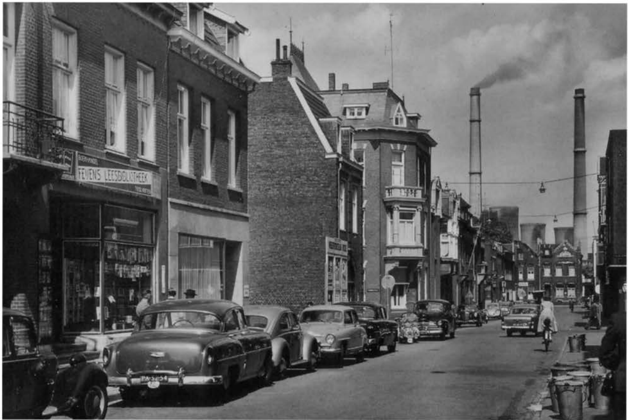
Winkels in de Honigmanstraat met links Feijens leesbibliotheek en op de achtergrond de rokende schoorstenen van de Oranje Nassau I. Op deze foto uit 1958 is goed te zien hoe de Lange Lies en de Lange Jan het Heerlense straatbeeld domineerden.

Stadsarchief Heerlen fotocoll.nr. 3810 14252