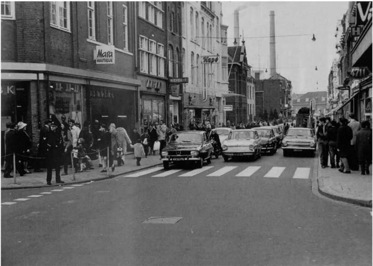
De Saroleastraat met links op de hoek de Limburgse Boek en Kunsthandel [LBK], en verderop Kapé. Rechts op de hoek Vinke, dames-en kinderkleding, voorheen Witteveen. Daarnaast lag apotheek Peereboom. Op de achtergrond is een deel van het stationsgebouw te zien en de twee schoorstenen van de Oranje Nassau Mijn I.

waren favoriet onder de jeugd. Konijnenvellen konden we ook bij Borghans kwijt. Daar wilde hij wel geld voor geven, een kwartje of zo. Wat hij zoal bijeengarde was niet te zien. Er lag een dikke deken over z'n handelswaar.