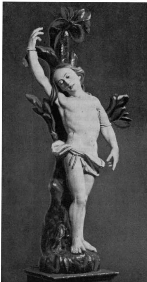
Beeld van de patroonheilige St.-Sebastianus, van lindenhout, 1.16 meter hoog. Het beeld had tot 1890 een waardige plaats op het rechter zijaltaar in de St. Lambertuskerk.

Slechts op onderdelen zijn enkele artikelen onder druk van de tijdgeest aangepast aan de veranderde omstandigheden. Bijvoorbeeld de 'Schützenführer', die nu kapitein heet. De functie van commandant is in het leven geroepen, die van de 'Bruderschaftsdiener' afgeschaft. Bestuurlijke zaken lagen in handen van de 'Siebenmänner', thans bij het