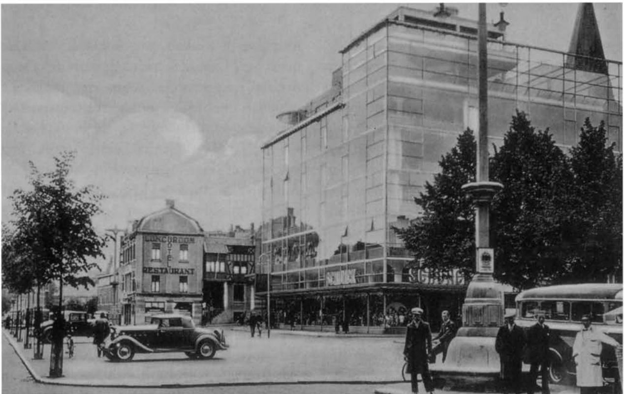
Het glaspaleis in de jaren dertig. Parkeren voor het gebouw was toegestaan.