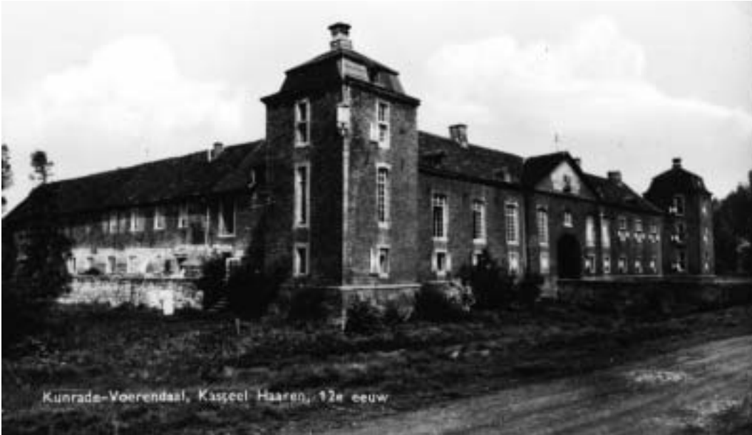
Kasteel Haeren omstreeks 1920. De gracht is nog aanwezig.

4 begon met het beleggen van een vergadering. Op zondagavond 22 februari verzamelde De Salve thuis een aantal gelijkgezinden om zich heen. 5