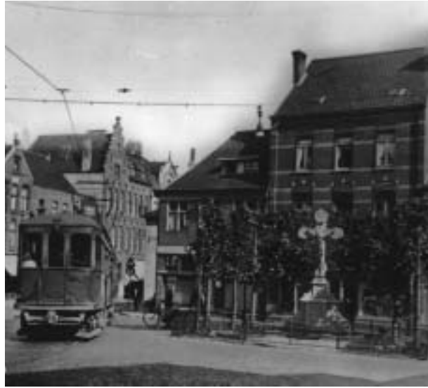
Het kruisbeeld met daarachter het café 'Hinger Herods vot'.

In datzelfde jaar, 1920, had er een plechtige