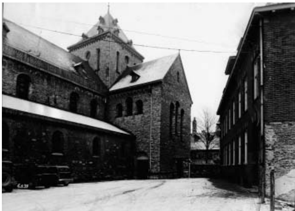
De Sint-Pancratiuskerk. Rechts de kapelanie.