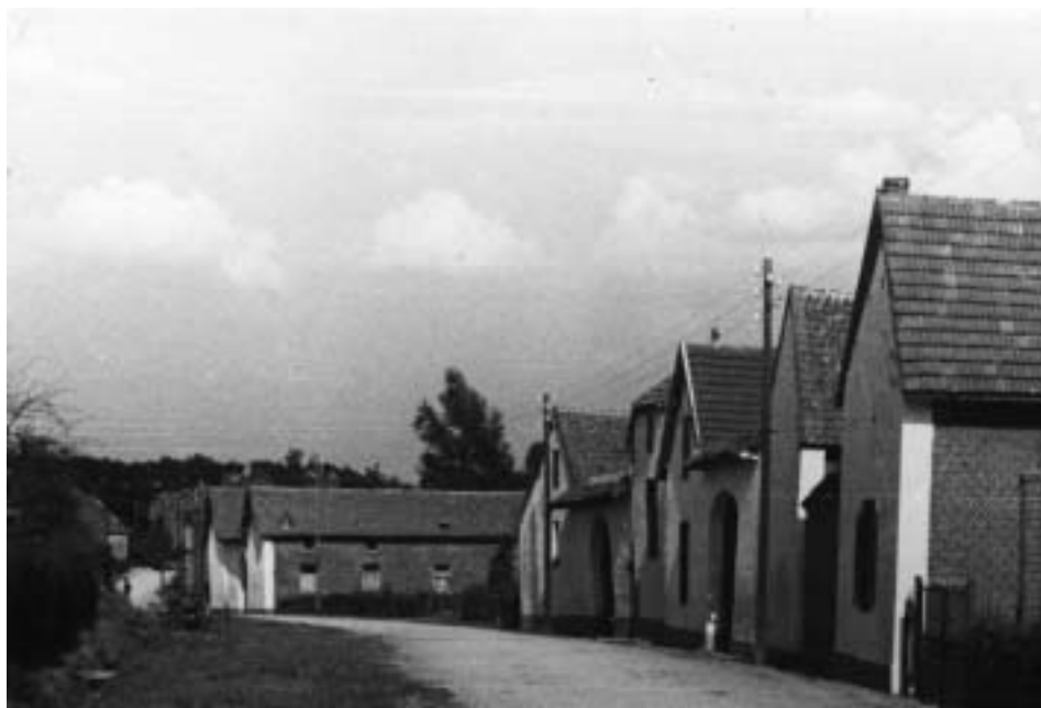
Gezicht op Retersbeek ca. 1920.