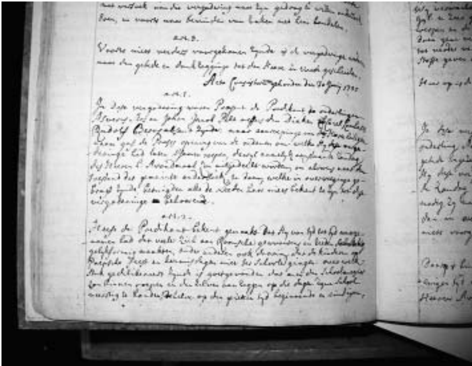
Notulen kerkenraad Hervormde gemeente, 30 juni 1735.

sa Heerlen, Archief Hervormde Gemeente Heerlen, inv.nr. 2.