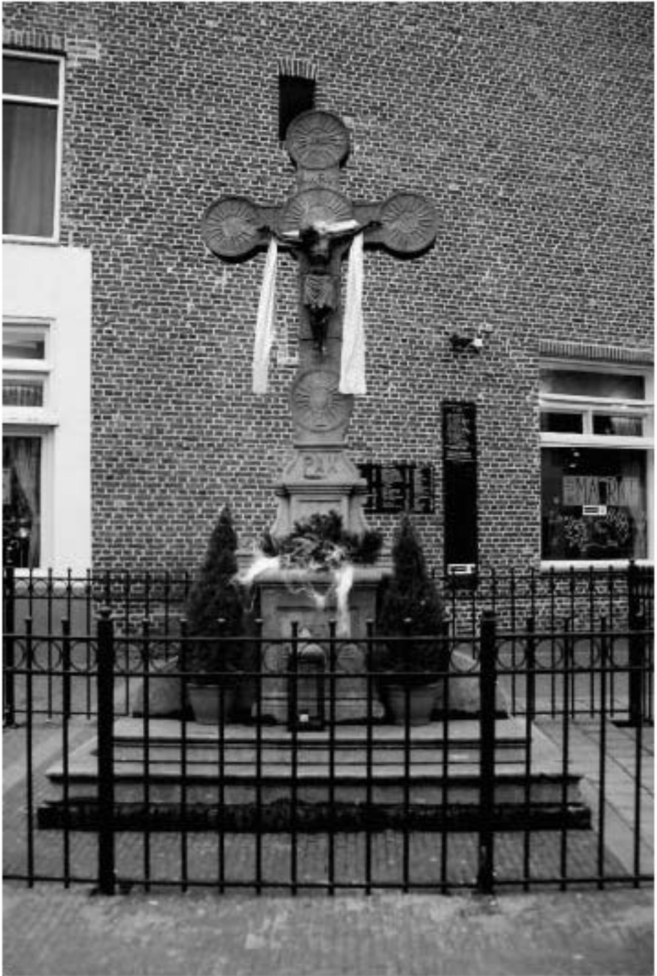
Het recent onthulde, gerenoveerde kruisbeeld op het Wilhelminaplein.