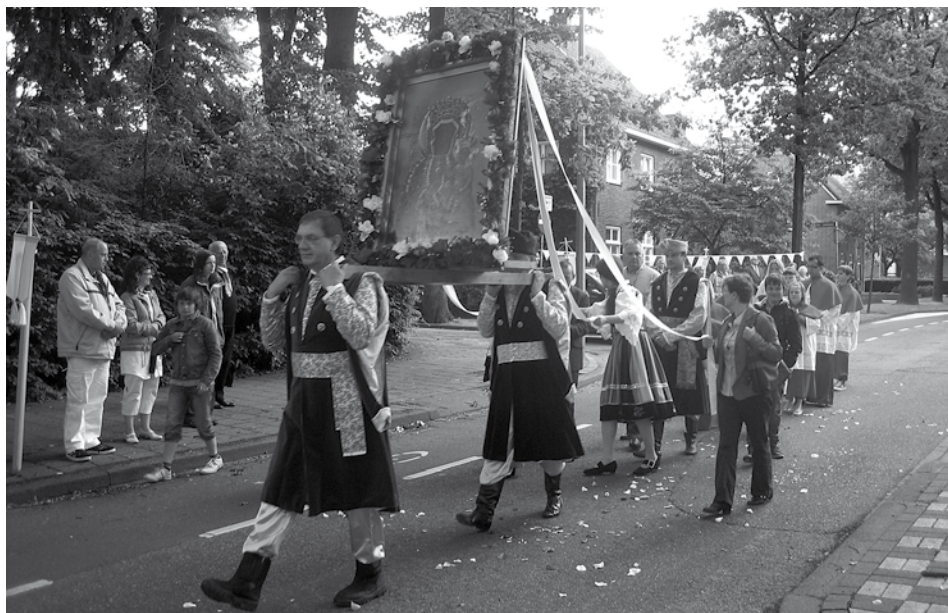
'Wojciech' neemt deel aan de sacramentsprocessie vanuit de Grote St. Jan in Hoensbroek. De beeltenis van de Zwarte Madonna wordt hierbij meegedragen door Wojciech leden in Poolse klederdracht. Deze foto is gemaakt op zondag 17 juni 2010.