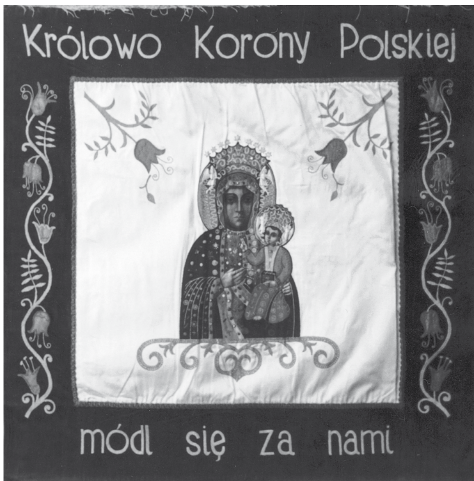
De achterzijde van de nieuwe vlag van 'Wojciech'.

Dit alles vergemakkelijkte het besluit van het bestuur van 'Wojciech' om de verenigingsactiviteiten na de komst van de nieuwe leden in de periode 1980-1985 te verleggen naar het Poolse Huis in Brunssum, waar bovendien de meeste nieuwe leden al het repetitielokaal van zangkoor Wesoły Tułacz hadden.