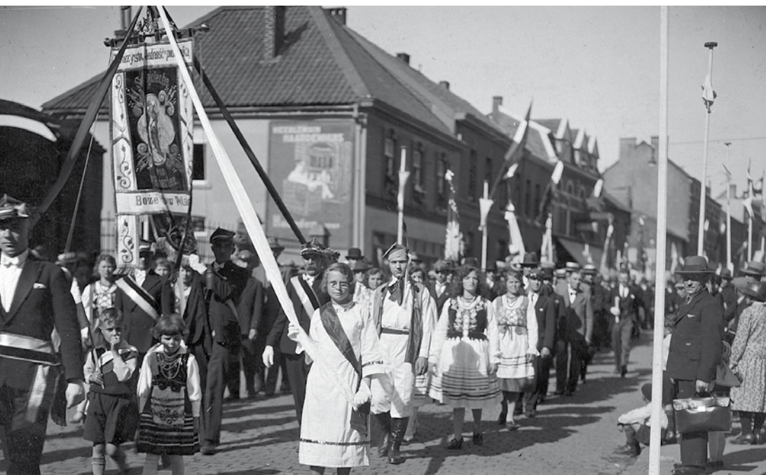
'Wojciech' neemt samen met de leden van haar dochtervereniging Wesoły Krakus deel aan de processie vanuit de Pancratiuskerk in Heerlen-Centrum. Indertijd [1930] had 'Wojciech' een vlaggedrager en twee assistenten, die de vlag escorteerden. Zij droegen bij alle officiële gelegenheden waarbij de vlag aanwezig was een sjerp met de Poolse nationale kleuren wit-rood en droegen een vierkante Poolse muts [' rogatywka ']. Deze traditie heeft tot zeker 1960 stand gehouden.

Tegen het einde van de Eerste Wereldoorlog bestond de Poolse gemeenschap in Zuid-Limburg uit ruim 2.000 personen. Dit zou echter al gauw drastisch slinken! Op 11 november 1918 eindigde de Eerste Wereldoorlog met de capitulatie van Duitsland. De Polen riepen toen direct, na meer dan 100 jaar geen eigen land gehad te hebben, de onafhankelijkheid uit. Veel Polen die naar West Europa waren gemigreerd, keerden in 1919 terug naar het onafhankelijk geworden vaderland, in de hoop nu in Polen wel een menswaardig bestaan te kunnen opbouwen.