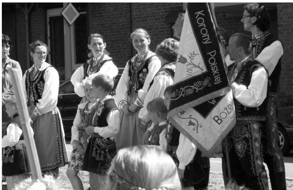
De oude traditie van deelname aan de processie in Heerlerheide werd door 'Wojciech' in 1996 weer opgepakt. Sindsdien neemt een delegatie van 'Wojciech' weer elk jaar aan deze processie deel. Deze foto is gemaakt tijdens de processie op zondag 5 juni 2010.