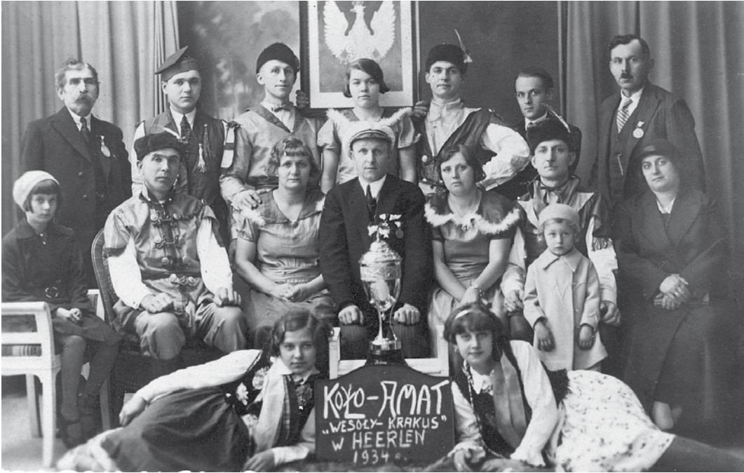
Wesoly Krakus, de toneelvereniging van 'Wojciech', in 1934. Een groot deel van de leden van Wesoly Krakus bestond uit jeugd, kinderen van Wojciech-leden.

met de processies vanuit de Pancratiuskerk te Heerlen-Centrum mee, maar waren ze met hun vlag ook present bij de processies die te Heerlerheide vanuit de Corneliuskerk georganiseerd werden. 12