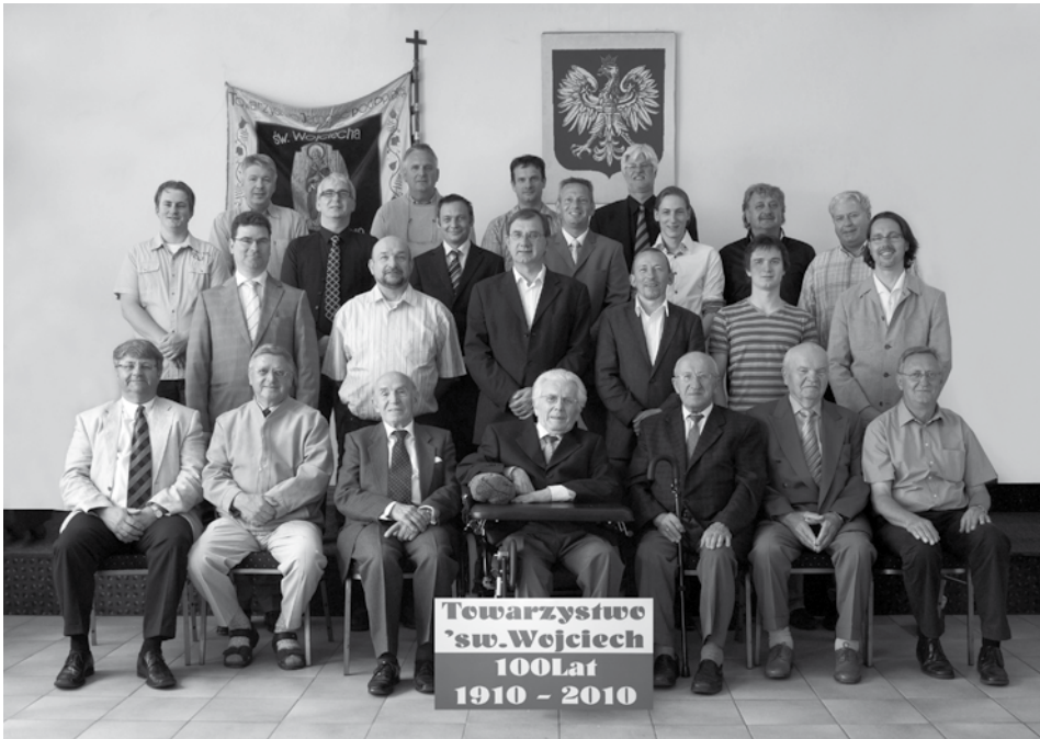
Foto gemaakt ter gelegenheid van het 100-jarig jubileum van de vereniging in 2010 in het Poolse Huis in Brunssum. Die dag moest de fotograaf concurreren met een uitzonderlijk mooie zomerse zondagmiddag. Hierdoor is een groot deel van het huidige ledenaantal niet op de foto te zien. De lokroep van het mooie weer bleek velen toch te machtig!

weinig activiteiten gekend, deels waarschijnlijk als reactie op het afketsen van de fusieopgingen. Voor een ander deel is het echter ook terug te voeren op het cyclisch karakter dat de verenigingsactiviteiten over de lange termijn te zien geven: Periodes van meer en minder hoge activiteitsniveaus wisselen elkaar af. Bestuursleden die zich lange tijd actief ingezet hebben voor de vereniging, stellen zich op zeker moment niet meer herkiesbaar; nieuwe enthousiaste en kundige opvolgers zijn vaak niet direct te vinden; er valt een gat en het duurt even voordat de volgende bestuurlijke generatie de smaak en het ritme van een goed lopende organisatie te pakken heeft. Gezondheidsproblemen van de voorzitter in de periode 2007-2008 hebben hier ook meegespeeld. 54