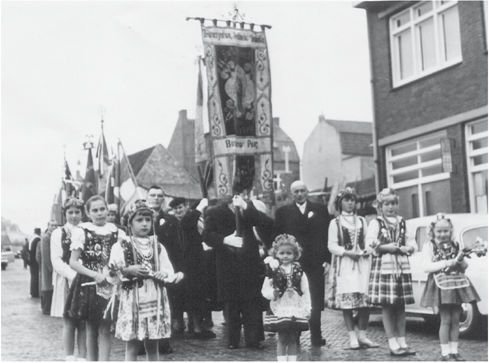
In gezelschap van de koninklijke fanfare St. Joseph, kinderen in Poolse klederdracht en delegaties van de andere Poolse verenigingen in Zuid-Limburg, ging 'Wojciech' in een plechtige stoet door Heerlerheide bij het gouden jubileum op 16 oktober 1960. Toen ging de oude vlag voor de laatste keer mee. Daarna is hij naar een museum in Poznan gebracht.

ademing op de intensive care, de prognose was niet best en het aangewezen beleid leek: Stekker uittrekken en niet reanimeren. De toenmalige voorzitter van ZKPT wist de vereniging echter te motiveren om het bijltje er niet bij neer te gooien. 40