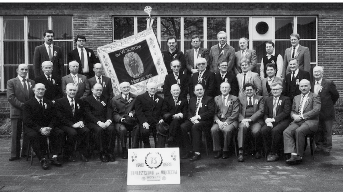
Statiefoto gemaakt van de vereniging ter gelegenheid van het 75-jarig jubileum van 'Wojciech' in 1985.