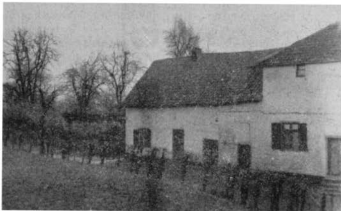
Het aan de Coriovallumstraat gelegen gedeelte van het huis Het Kruis, waar de steen met inschrift is gevonden.

Aan dit uithangteken heeft de Kruisstraat haar naam te danken. Einde van de vorige eeuw werd deze straat vanaf het kruispunt aan de Geleenstraat en de Geerstraat tot Oppen Linge (Op de Linde), nog aangeduid met de naam „Igge Kruts”. Dit is echter niet de oorspronkelijke naam van deze straat. In de volksmond was tot einde van de vorige eeuw steeds sprake van OPPEN WEËSJEL (OP DE WEEGSCHIED of WEEGSCHIED), waarmede niet alleen de Kruisstraat doch ook de buurt van het kruispunt van de beide grote romeinse wegen Aken—Tuddern en Tongeren—Keulen, die elkaar aan de WEEGSCHIED kruisten, werd bedoeld*).