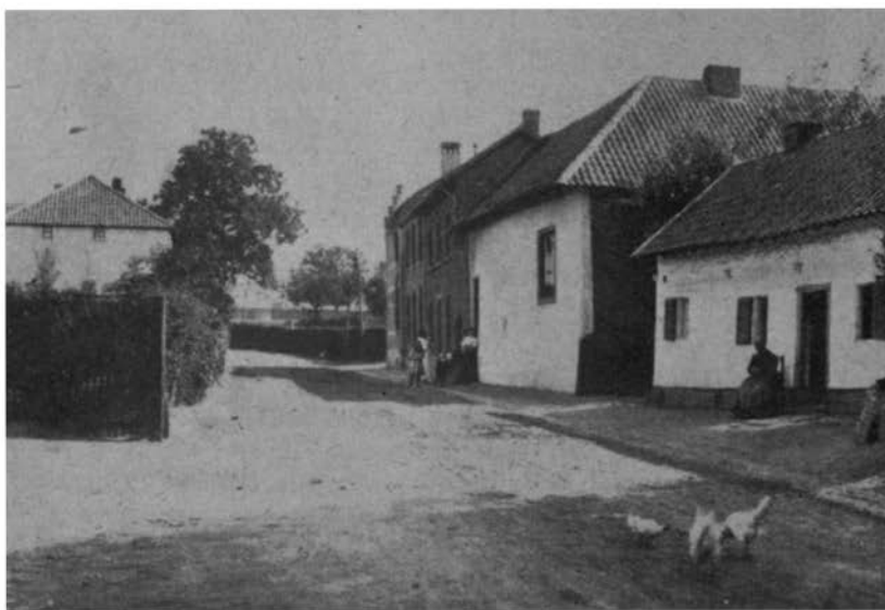
Kruisstraat omstreeks 1908; links gedeelte van het huis Het Kruis.

Met dit pand is wederom een van de oudste Heerlense huizen verdwenen. Dit huis genoot geen bijzondere bekendheid en het heeft, voor zover kan worden nagegaan, in het verleden geen uitzonderlijke bestemming gehad. De meesten zullen zich dan ook dit huis nauwelijks meer kunnen voorstellen. Al behoeft men de verdwijning van dit bouwvallige huis — een sta-in-de-weg voor het moderne verkeer — niet te betreuren, toch menen wij, dat de geschiedenis van dit gebouw onze aandacht verdient. Einde van de vorige eeuw bestond het pand uit drie afzonderlijke woonhuizen. In vroeger tijd is dit pand één enkele woning geweest, die, zoals wij nader zullen zien, later is gesplitst.