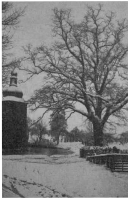
Eik bij het kasteel Schaesberg, gepland in 1650, gekapt in 1918. Het is „de boom”, waarover Frans Erens schreef.

dennenbosch. Daarin lag de heuvel, de Ravensmaar, wiens naam men wel afleidde van Ave-Mariaberg, maar bij nadenken is het mij duidelijk geworden, dat hij wilde betekenen: de heuvel bij de maar 2) , waar de raven kwamen drinken. Die maar was ineengeschrompeld tot een kleine welput in het bosch, waar het water kristallijn was, ongeschonden en zuiver. Ik heb daar als kind in den zomer uren gelegen. Ik klom in de dennetoppen en haalde er de eieren uit de kraaienesten.