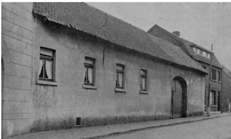
Oud huis Eymael Schandelen

Eén van de volmolens was gevestigd in de nog bestaande vroegere oliemolen bij het Aambos, de andere was gelegen bij het kasteel Meezenbroek en is sinds lang verdwenen. De plaatselijke benaming van de beemden tussen de Schandelermolen en het kasteel Meezenbroek „Agen Volmeúe” legt getuigenis daarvan af.