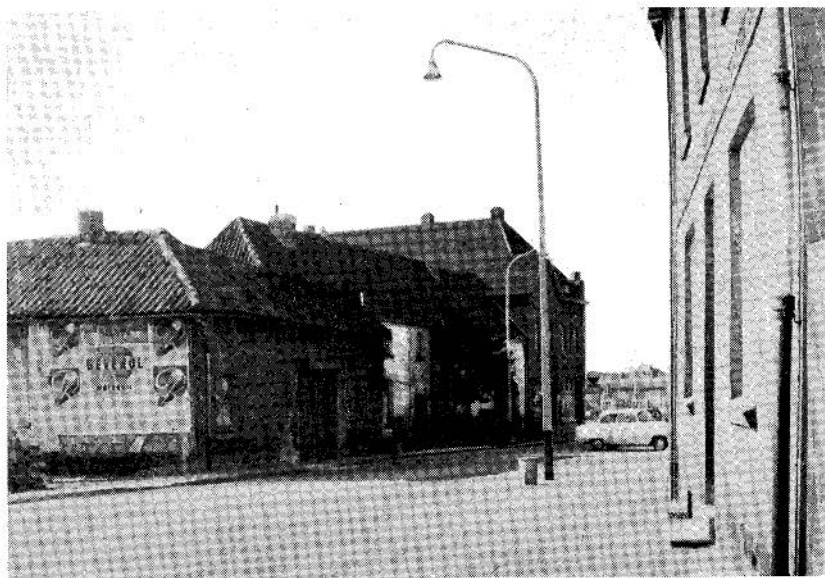
De Aldenhof te Hoensbroek gezien vanuit het N.O. 1958. (De oorspronkelijke schuur is verbouwd tot café-restaurant (hotel) en tot winkel)

Aan de westkant was dit huis door een schuur geflankeerd. Het gebouw gaf cachet aan de straat en had een riant aanzien met aan de achterzijde dienst en stalgebouwen. Het was, naar de trant van de vroegere Franken, op een helling gebouwd dicht bij een lager aanwezige waterlossing.