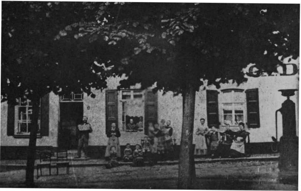
Kerkplein-noordzijde, met pomp ± 1860; op tekening gemerkt B.

De waterinhoud van deze put schijnt echter in deze tijd niet geheel voldoende te zijn geweest, waardoor de bewoners van het Kerkplein aangewezen waren op de openbare waterput aan de Veemarkt (Wilhelminaplein). Immers op 16 augustus 1867 richtten enige bewoners van het Kerkplein zich in een verzoekschrift tot het gemeentebestuur om een nieuwe put met pomp aldaar te laten aanleggen: