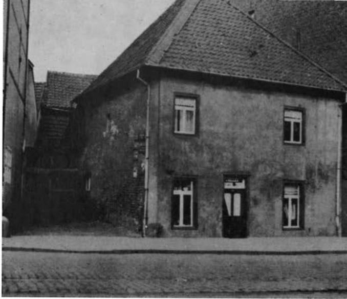
Woning van de voorganger te Heerlen, Veemarkt = Wilhelminaplein; links de ingang naar de sjoel. Afgebroken kort na de ingebruikname van de nieuwe synagoge in de Stationstraat, 1936. (Cliché Rijksdienst voor de Monumentenzorg).

H. Dassen liet daarom de hele begraafplaats overdekken door een betonnen plateau, waarmee hij een verhoogd plein vormde voor de sjoel. Zo zijn de graven intact en bereikbaar gebleven en kunnen ook kohaniem het gebouw zonder bezwaren van rituele aard betreden. Kohaniem of afstammelingen van de priesters moeten namelijk elk contact met gestorvenen, zelfs het meest indirecte, vermijden. De synagoge uit 1936, die in de oorlog geheel werd leeg geroofd, dient sinds het herstel in 1959 tot bedehuis voor een gemeente van ongeveer 50 zielen 12) .