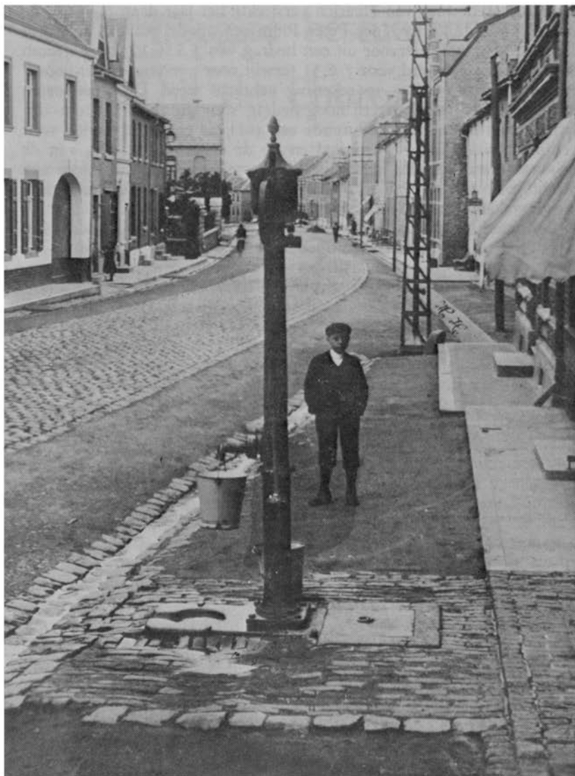
Geleenstraat omstreeks 1902.