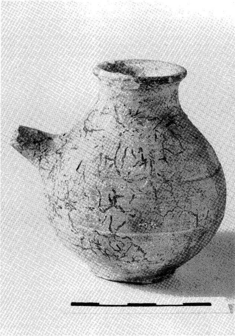
Abb. 1. Säuglingtrinkgefäss, Thermenmuseum, Heerlen.