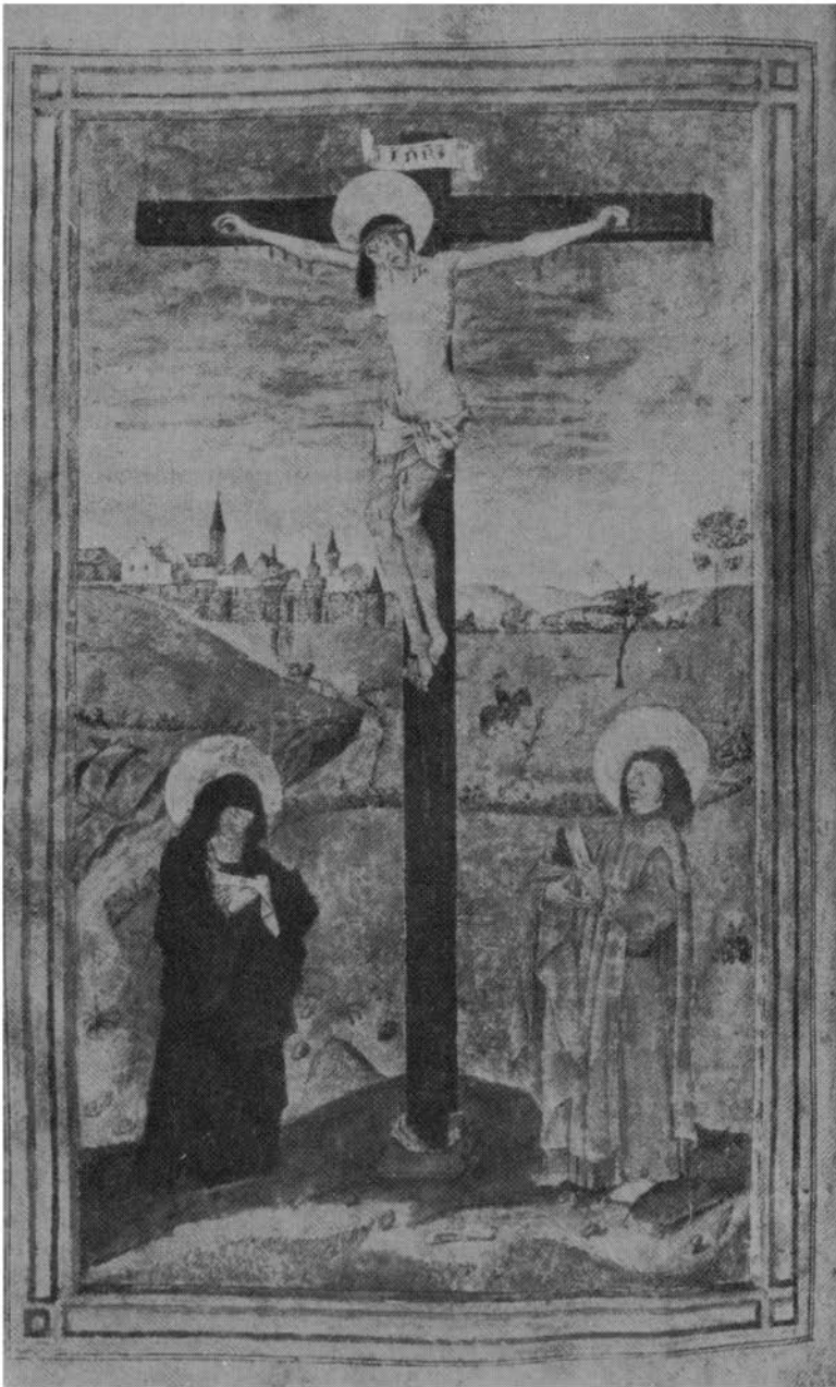
Canonblad uit het mis-antiphonarium met op de achtergrond het silhouet van Euskirchen.