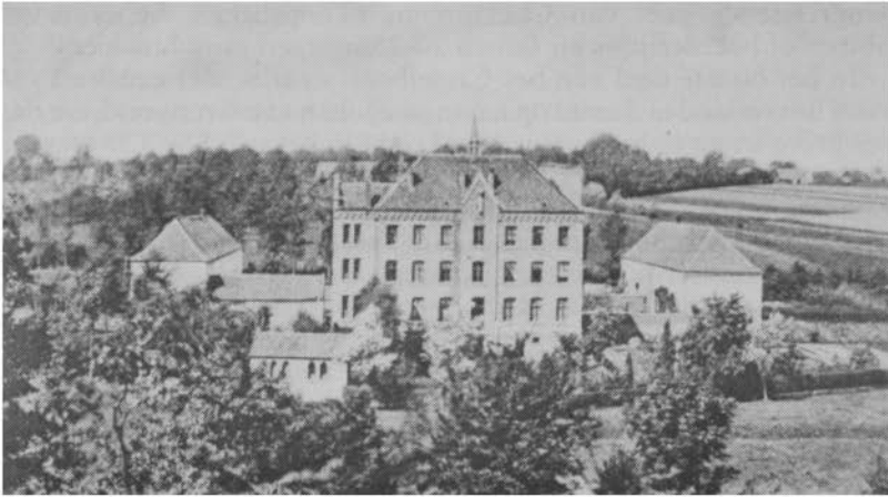
Huize Sint Elisabeth, toestand eind 19e eeuw, gezien vanuit het oosten. Het middengebouw, het klooster, werd in 1877 gebouwd op de fundamenten van kasteel 's-Heren-Anstel. Links en rechts bevinden zich de gebouwen van de oude kasteelboerderij. Deze situatie is goed te herkennen op de Tranchotkaart.

mandalos siliginis”, vermoedelijk 4 malder en 7 summeren of 7 vaten 25 . Het is een cijns in natura die door een aantal laten moest worden opgebracht, zoals we die in ruime mate gevonden hebben bij Erenstein. Men zou kunnen denken aan de bewoners van het „panhuis” die 4 malder rogge moesten opbrengen.