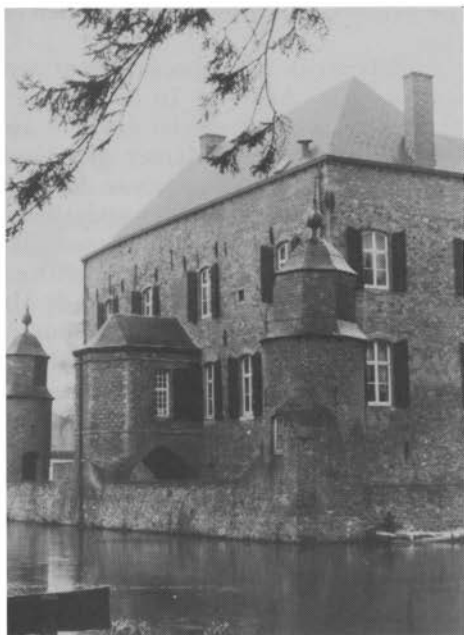
Kasteel Erenstein in de tegenwoordige toestand, gezien vanuit het zuidoosten. Op de lage kade langs de vijver stond in de middeleeuwen de ca. 2,5 m. hoge ringmuur. De ronde vrijstaande torentjes, de aangebouwde kapel en de vensters dateren uit de 18e eeuw.

zijn opnieuw gegroepeerd en soms met latere notities vermengd, zodat de oorspronkelijke chronologie in de aantekeningen is verstoord 15 . Men kan beter uitgaan van het eerste register zelf, ofschoon het alleen in handschrift te Brussel is te raadplegen. Het wordt „het oude boek” genoemd, tegenwoordig ook wel „Casselboek”, naar de klerk Willem van Cassel die er eind 1312 mee begon, bij het begin van de regering van hertog Jan III. Toen moesten de leenmannen leenhulde aan de nieuwe heer betuigen; daarbij werden hun namen en goederen genoteerd 16 .