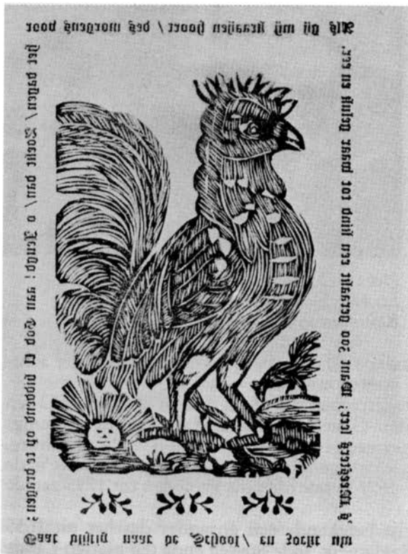
Een pagina uit een "Haneboek".