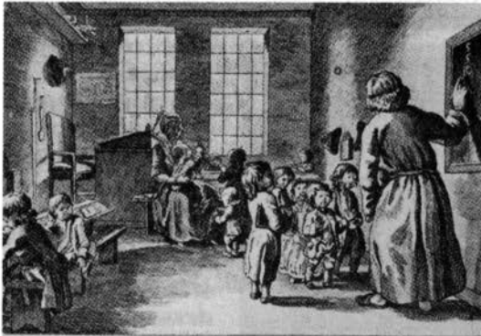
Cyffermeester, leer de Kunst, hoe men telt in 't kort. Kinderen leert dan hoe een groot uit veel kleintjes wordt.

Klassikaal onderwijs was natuurlijk niet mogelijk op scholen met een zo ongeregelde opkomst van leerlingen, wier leeftijd bovendien