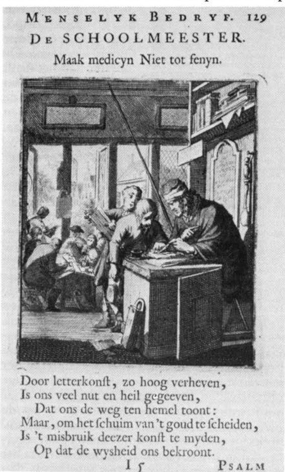
De schoolmeester. Ets van J. Luiken.

Naast het ABC-boek was de Heidelbergse catechismus het meest gebruikte boek op de scholen. Het was gewoonte geworden dat elke zondag de middagdienst aan de catechismus werd gewijd. De vragen van de betreffende zondag werden dan door de predikant verklaard en de knapste kinderen moesten deze vragen voor de kansel kunnen beantwoorden. Voorts werden op school de psalmen ingestudeerd.