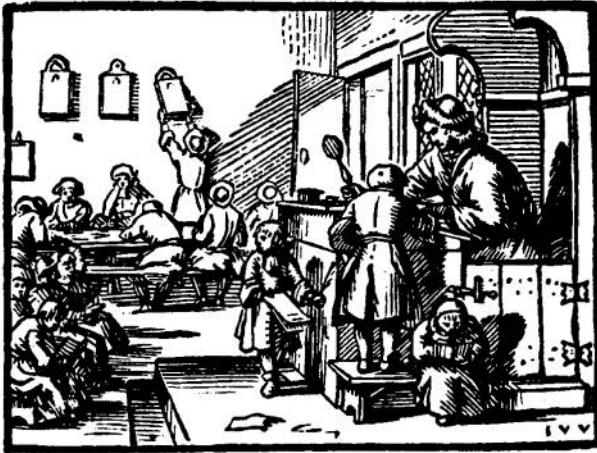
Schoolinterieur. Houtsnede van J. van de Venne, achttiende eeuw. Rijksmuseum Amsterdam.

De inhoud van dit elementaire onderwijs - godsdienst, lezen en een beetje schrijven - was overal in de Republiek gelijk. De schoolmeesters werden meestal door de politieke overheid aangesteld. De kerk kon echter op de benoeming invloed uitoefenen, vooral daar waar het ambt verbonden was aan dat van koster, voorlezer en voorzanger. In de loop der tijden werd het gebruikelijk dat aan een aanstelling een vergelijkend examen voorafging. De meesters kregen vrij wonen en een nogal laag basissalaris, dat werd aangevuld met inkomsten uit andere functies en met schoolgeld. Dat schoolgeld werd laag gehouden. Het bleef twee eeuwen lang bijna overal vier stuivers per maand voor kinderen die leerden lezen en zes stuivers voor wie bovendien leerde schrijven. De ouders betaalden alleen voor de tijd dat het kind ook werkelijk de school bezocht. Die 'school' bestond meestal uit één vertrek. In de dorpen kon dat een afmeting van circa 40 m 2 hebben en in de drukke wintermaanden