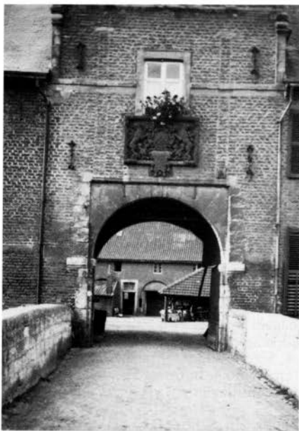
De toegangspoort van kasteel Wijnandsrade.

De stichting, die begin 1990 eigenaar werd van het kasteel, wil in de bovenverdieping van deze vleugel vier appartementen onderbrengen, zegt voorzitter H. Berger. In de bovenverdieping van de vleugel direct tegenover de poort moeten nog eens twee woningen komen. Beneden is plaats ingeruimd voor een (conferentie)zaal. Wat met het oudste gedeelte van het kasteel, de vleugel direct links van de poort, moet gebeuren, is nog niet precies bekend. In dit gedeelte bevond zich de riddersaal. Mogelijk komt ook in dit gedeelte van het kasteel een