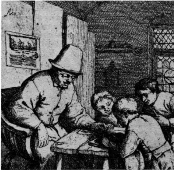
Het overhoren van leerlingen. Ets van A. van Ostade, zeventiende eeuw. Rijksmuseum Amsterdam.

Gaandeweg kwam er kritiek op het bestaande onderwijs en de verlichte burgerij ging uitzien naar scholen waar de kinderen begrepen wat zij leerden en waar zij niet werden volgestampt met de leerstellingen van de heersende kerk. De kritiek richtte zich ook op de leeromstandigheden: de klassen waren te groot geworden. De oplossing meende men in klassikaal onderwijs te hebben gevonden. De kritiek was zeker gerechtvaardigd. Toch was er in twee eeuwen tijd wel iets bereikt: er was een 'schoolmeestersstand' ontstaan, waarvan de leden in een veel betere positie verkeerden dan in 1600 het geval was, en het schoolgaan was voor grote bevolkingsgroepen meer vanzelfsprekend geworden.