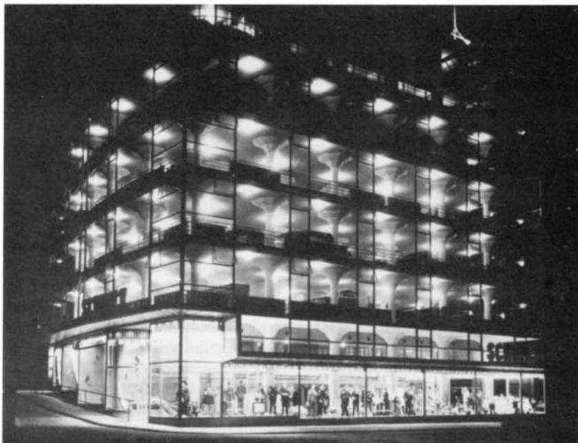
Glaspaleis te Heerlen rond 1935.

Wat hebben steden als Moskou, Sofia en Rome gemeen met Heerlen? Moskou heeft zijn Narkomfin-gebouw, Sofia zijn Ozvobozhdenie-bioscoop, Rome zijn Palazzo Postale. En Heerlen? Heerlen heeft ... het Glaspaleis. Wat die gebouwen met elkaar verbindt is DoCoMoMo 1 . Dit is een internationale vereniging die streeft naar het inventariseren, documenteren en conserveren van de producten van de Moderne Beweging: een architectuuropvatting die in Europa tussen de jaren 1925 en 1965 van enorme betekenis is geweest. Van de producten van die Moderne Beweging, of het Nieuwe Bouwen, zoals de Nederlandse variant heet, bezit Heerlen er een tiental