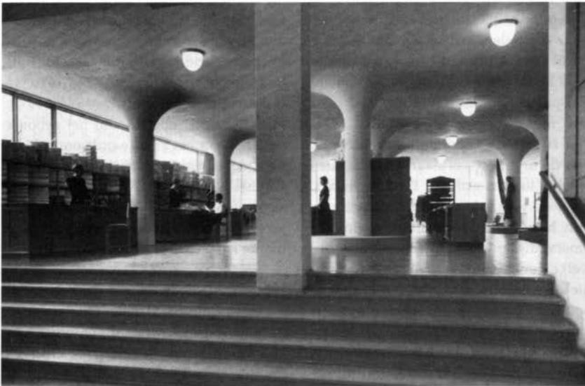
Interieur van het Glaspaleis.

aanwezig. Om het nog ingewikkelder te maken gebruikte Peutz in zijn eigenhandige beschrijving van het Glaspaleis in het Katholiek Bouwblad zelfs de typerende terminologie van het Nieuwe Bouwen. Deze terminologie verwees naar de nieuwe en op technologie gebaseerde cultuur zoals die in scheepsbouw, auto-industrie en vliegtuigbouw tot uitdrukking kwam. Maar wat het Glaspaleis, buiten de reeds bekende karakteristieken zoals de paddestoelconstructie, de glasarchitectuur en het ontluuchtings-systeem, uniek in Nederland maakt, is dat het zich perfect voegt in een volstrekt historische omgeving. Brinkman en Van der Vlugt bij de Van Nelle-fabriek in Rotterdam en Duiker bij het sanatorium Zonnestraal in Hilversum hadden een dergelijk probleem niet op te lossen. Deze Nederlandse toppers van het Nieuwe Bouwen werden in een vrije en onbebouwde omgeving neergezet. Peutz daarentegen had rekening te houden met een Romaans monument en een vrij organisch gebouwde omgeving binnen