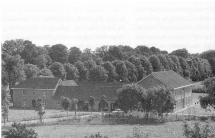
De nieuwe woonhuizen gezien vanaf motel Heerlen.