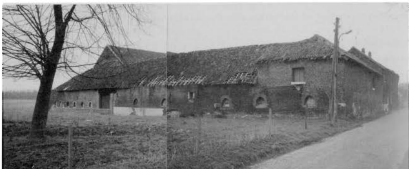
De Hoeve Overste Worm vóór de verbouwing.