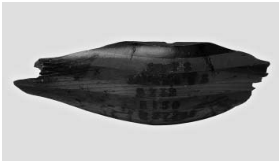
Afgebroken propellerstuk van de in 1928 in Heerlen neergestorte vliegmachine.

Hij vraagt toestemming, om een onderzoek