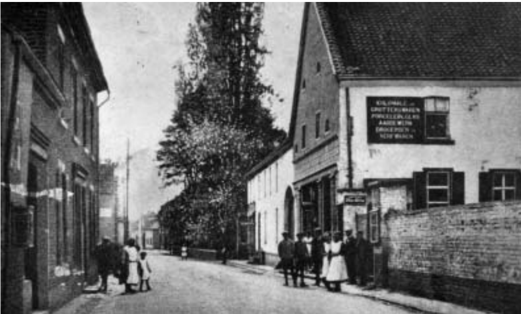
De Hoofdstraat van Hoensbroek in de nabijheid van het woonhuis van de notaris.