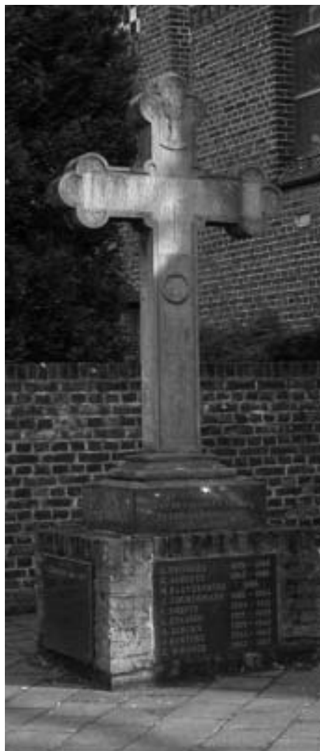
Kruisbeeld met de namen van de pastoors bij de ingang van het kerkhof