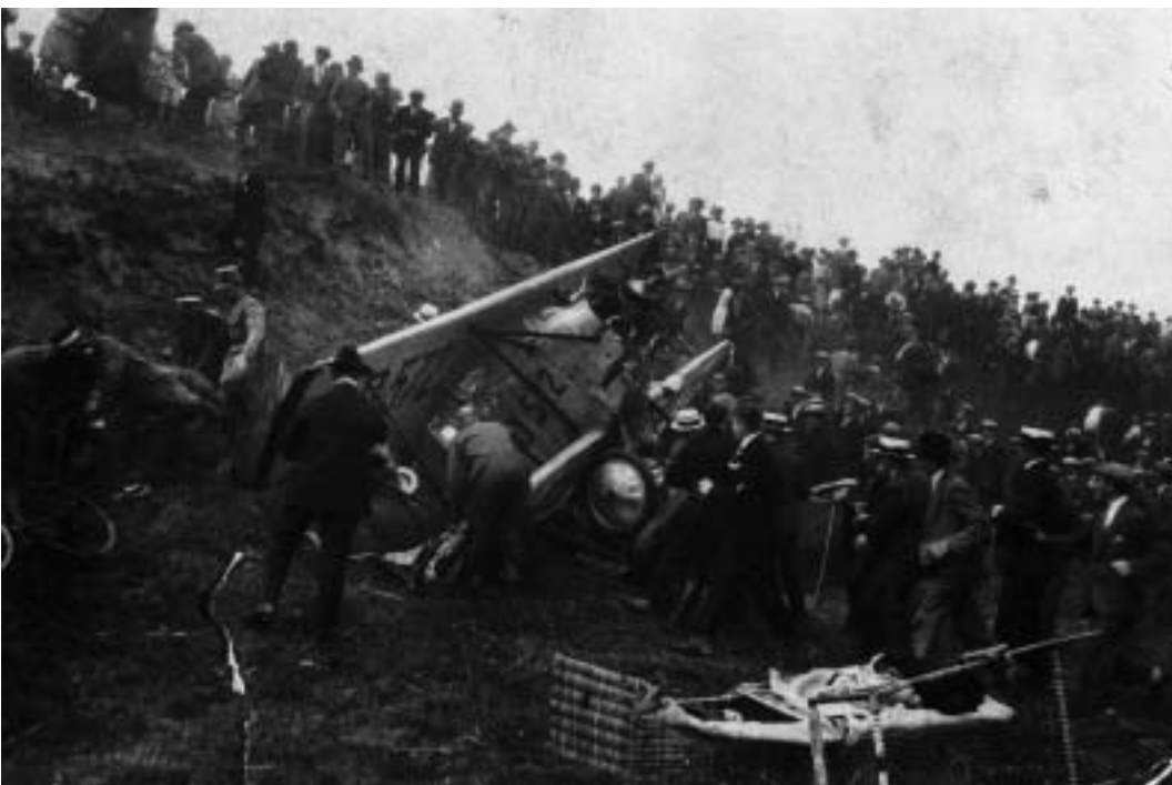
De vliegramp aan de Schelsberg in 1928.

te doen, om op particulier terrein een vliegterrein aan te leggen, waarbij dan wel 'de heeren van de Koninklijke Luchtvaart Maatschappij in verband met dit plan hier ter plaatse de algemeene situatie komt overzien.' Op 19 mei antwoordt het gemeentebestuur dat zij het onderzoek niet nodig achten. De eerder genoemde kaart is overigens nog niet in de archieven aangetroffen. 6