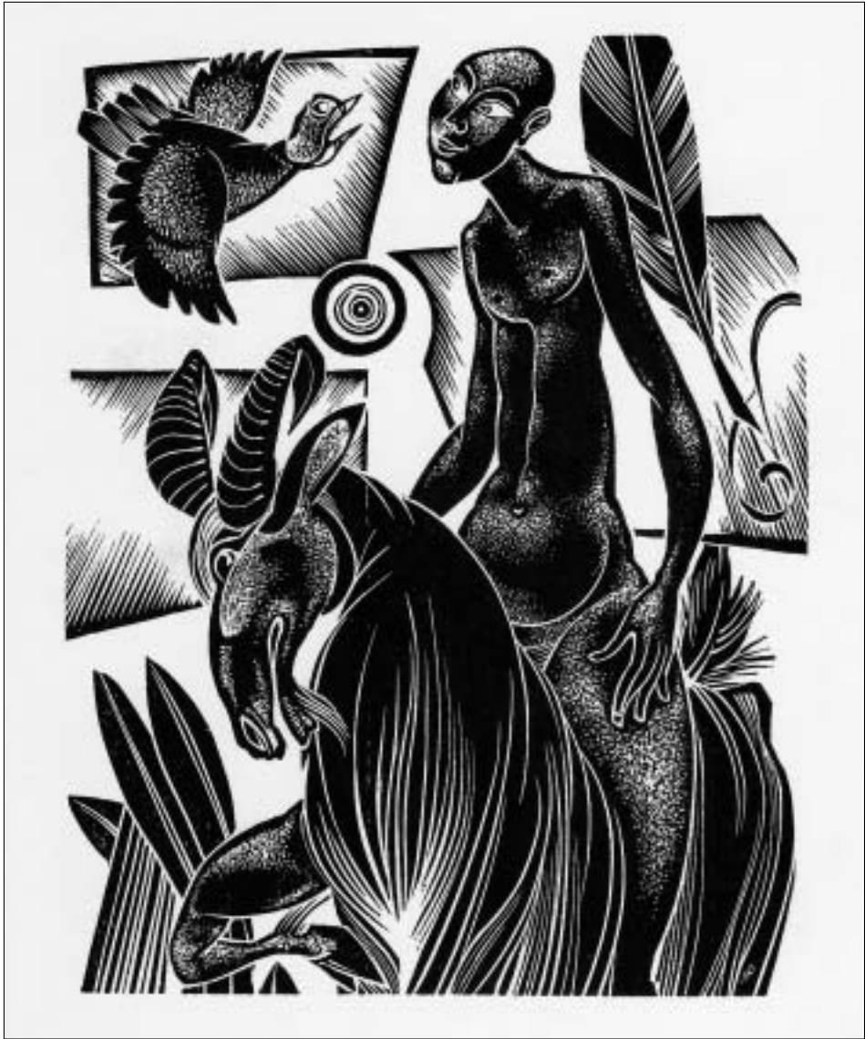
Hedwig Pauwels, Houtgravure.

adressen van verre nazaten en doen zij een oproep aan heemkundigen, genealogen en stamboomonderzoekers om zoveel mogelijk mensen op te sporen bij wie het groene bloed van les Boucs-verts door de aderen stroomt.