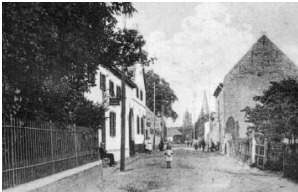
Voor het woonhuis van de notaris lag een grote tuin. Sommigen spreken van een park. Daardoor komt het woonhuis in de Hoofdstraat zelf op geen foto voor.