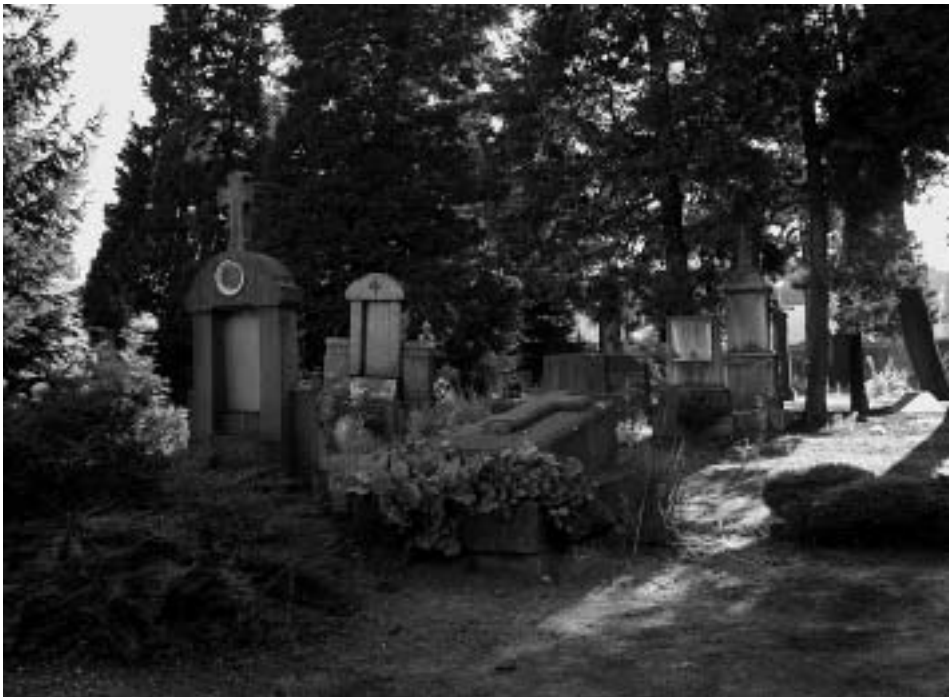
De oude begraafplaats bij de kerk verkeert in slechte toestand.