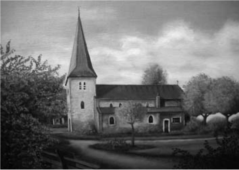
De oude St.-Janskerk te Hoensbroek.