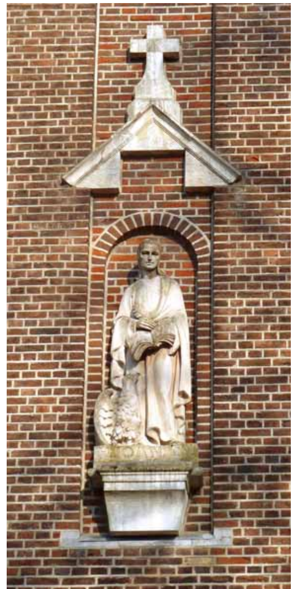
Het beeld van Johannes de Evangelist boven de ingang van de grote St. Janskerk.