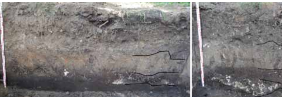
Zuid [links] en westprofiel van de funderingsput [rechts]. Het zwarte gedeelte onderin beekafzettingen en daarboven duidelijk zichtbaar een laag van kalksteenpuin.

Het dempen van de oude grachten had plaatsgevonden in 1967. Tevens werd vermeld dat de heuvel aan de oostzijde over een groot oppervlak aanzienlijk was verlaagd. In 1986 werd op hetzelfde terrein melding gemaakt van de waarneming van een stenen fundering op een diepte van 1,0 m onder het maaiveld. 47