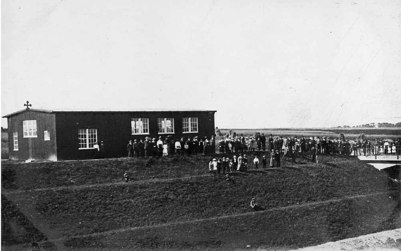
De kerk in het interneringskamp te Brunssum-Rumpen