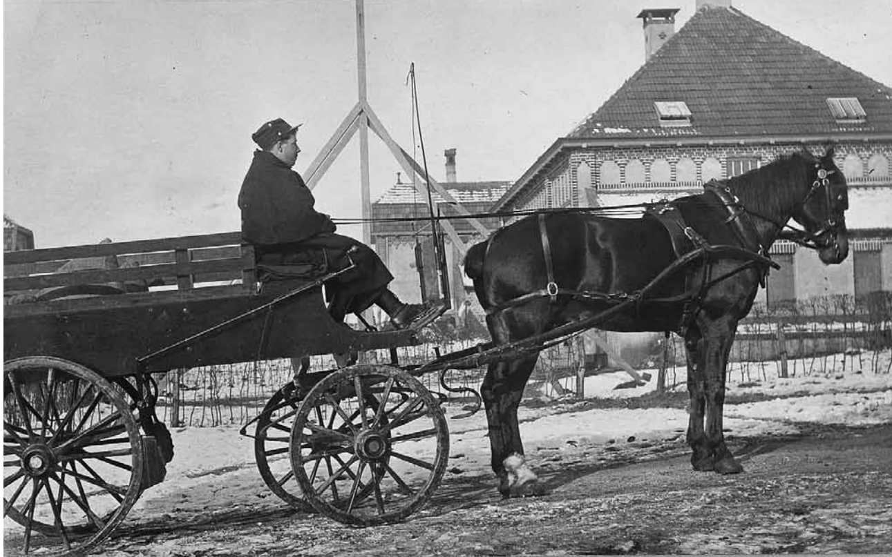
Paard en wagen met voerman van het interneringsdepot Heerlen in het kamp Beersdal te Heerlen.

vanwege de in de laatste jaren steeds verder gestegen kosten van levensonderhoud. De Christelijke Mijnwerkersbond steunde deze activiteiten niet. Ook de directies van de Mijnen waren hier tegen. Zij maakten eventuele stakers er op attent dat stakingsactiviteiten zouden leiden tot ontslag en terugzending naar het militair interneringskamp te Zeist. De plaatselijke politie had in die dagen versterking gekregen van de marechaussee voor het geval het tot rellen zou komen. In juni 1917 werd tot actie overgegaan. Met spanning werd uitgezien naar het gedrag van de eerste groep Belgische mijnwerkers bij aankomst aan de Oranje Nassau I. De Belgen bleken solidair met hun Nederlandse collega's en staakten mee. Ze werden teruggezonden naar het kamp te Zeist. De roep om kolen in Nederland bleek echter groter dan de wens om Belgische stakers hun werk bij wijze van discipline maatregel te ontnemen. Na enkele dagen werd over de 'misstap' niet meer gesproken. De stakers mochten weer terug naar de Mijnstreek om hun arbeid voort te zetten. 9