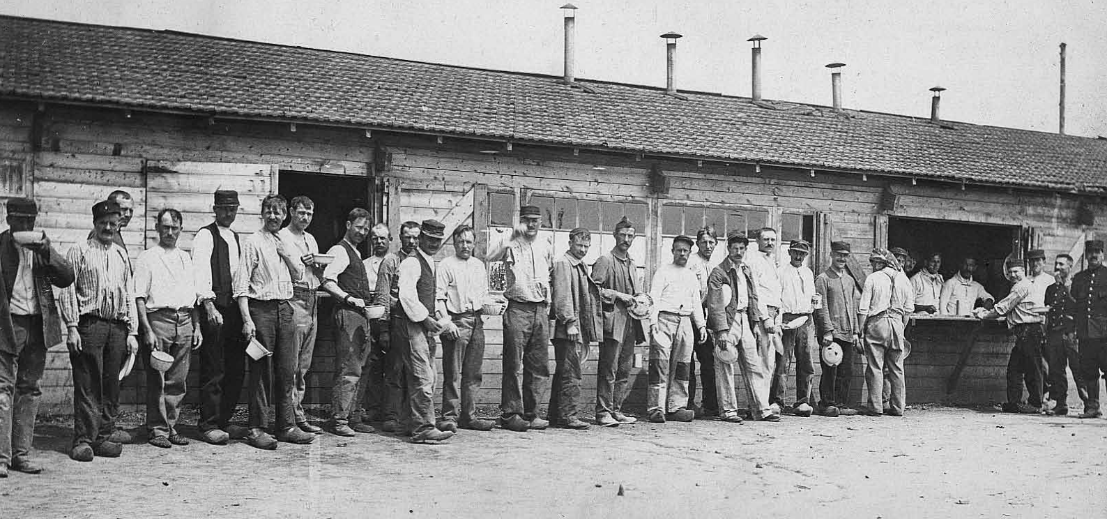
Uitdelen van soap in het interneringskamp te Brunssum