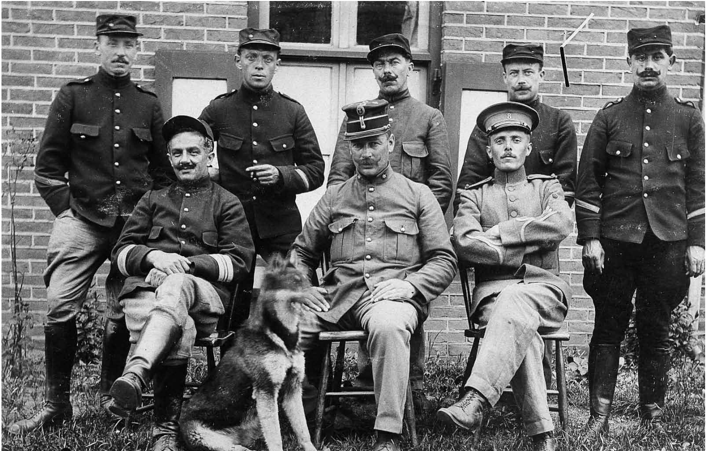
Onderofficieren van het interneringskamp Spekholzerheide.