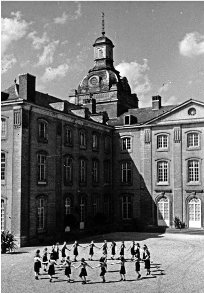
Amstenrade is een 'gastvrij' huis, ook tijdens de Tweede Wereldoorlog en dan voor de NSB-Jeugdstorm [1942].