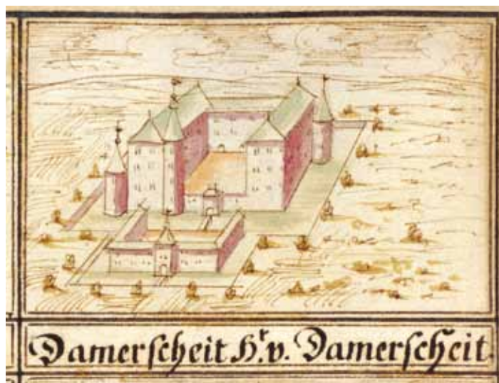
Impressie van het latere kasteel Dammerscheid. 'Dammerscheid' in de codex Welsler, gemaakt rond 1723. Bron: Bayerische Staatsbibliothek, München, Cmg 3635, fol. 26ro (detail).

Ook in de nagelaten goederen van Willem van