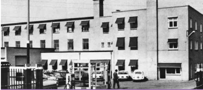
Oord van geldelijk gewin en van menselijk drama: de voormalige 'dermfabrik' [Parasinfabrik] aan de Hommerterweg te Amstenrade.