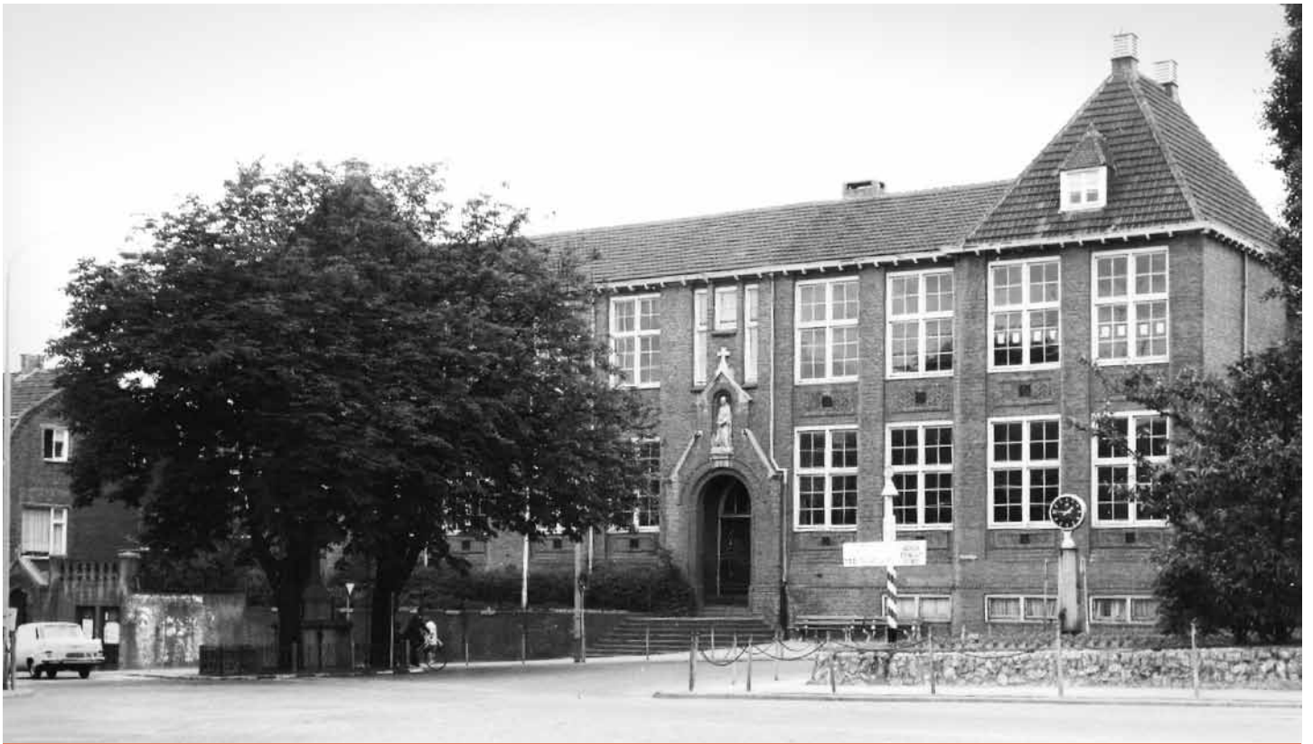
Jaren '60 - De St. Jansschool 'aan het kruis' (tussen de bomen links staat het kruisbeeld), gezien vanuit de Nieuwstraat. Hier ligt nu het Gebrookerplein. De auto links rijdt de Hoofdstraat af. Het beeld van Johannes de Evangelist is te zien boven de ingang van de school.