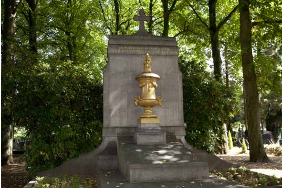
Dit grafmonument op de Algemene Begraafplaats aan de Akerstraat in Heerlen werd opgericht in 1925 ter herinnering aan 15 overleden Belgische geïnterneerden tijdens de Eerste Wereldoorlog.