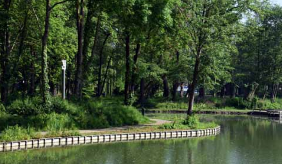
Impressie van de motte