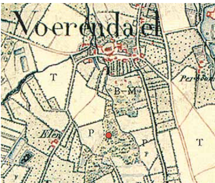
Tranchotkaart met daarop de toegangsweg naar 't Brook en met rode stip de motte

Dat de Borgberghse weg de huidige Valkenburgerweg kruiste - halverwege de achttiende eeuw werd nog gesproken van de Maestrichterweg - blijkt ook uit een pachtcontract uit 1751. Verpacht werd namelijk de 'runderweyde' en uit de pachtovereenkomst blijkt dat dit weiland werd begrensd door twee wegen, namelijk de Maestrichterweg en de Borghbergse weg. 35