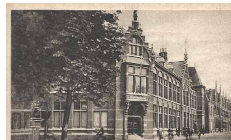
Venlo. Rijks H.B.S. Meerdijkstraat.

Rijks – HBS Venlo.