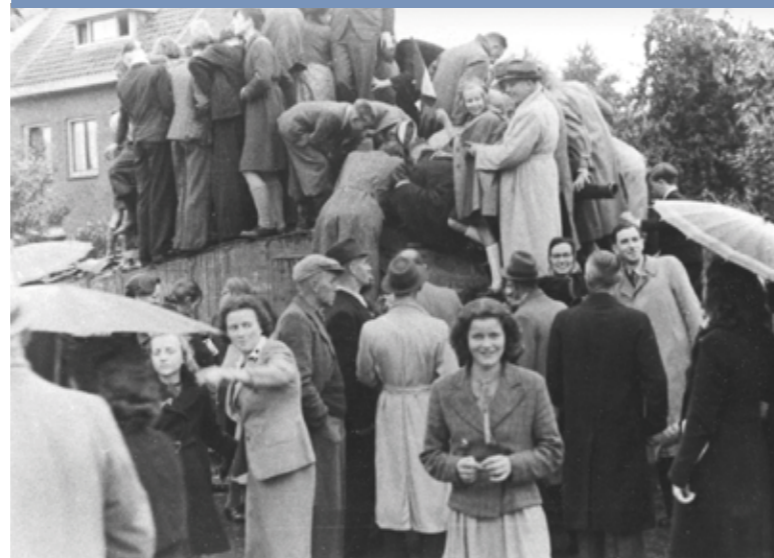
Tientallen mensen op een M4 Sherman tank. Euforie bij de bevrijding!