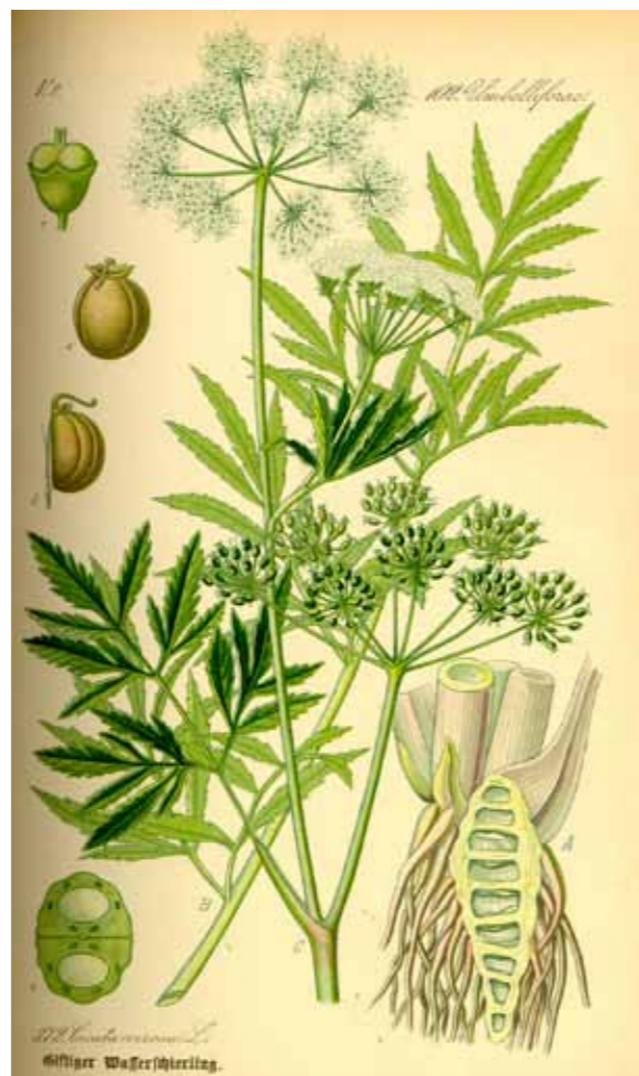
Waterscheerling ( Cicuta virosa )

Wat betreft de kleur kon een Dolle Kruidenextract van zichzelf al groen zijn, zo blijkt uit een in Keil (1767) opgenomen recept van een slaapverwekkende en pijnstillende populierenzalf. Ook hier is de tekst waar nodig 'vertaald' in modern Nederlands omwille van de leesbaarheid. In deze zalf zit Bilzekruid en Populier verwerkt. Om de zalf te maken zijn nodig: drie pond verse Populierknopjes, zes pond varkensreuzel, negen handenvol bladeren van Wilde Maankoppen (Klaprozen), zes handenvol Bilzekruidbladeren en twaalf handenvol Nachtschadebladeren (welke wordt in het recept niet vermeld). De gestampte kruiden worden tegelijk met de Populierknoppen en reuzel zachtjes gekookt totdat al het vocht verdamp is en de stelen van de kruiden hard beginnen te worden. De kruiden worden daarna uitgewrongen in een pers en vermengd met de reuzel. Deze zalf heeft verkoelende en verzachtende eigenschappen die werkzaam is bij onder meer aambeien. De zalf had een groene kleur afkomstig van de bladgroenkorrels