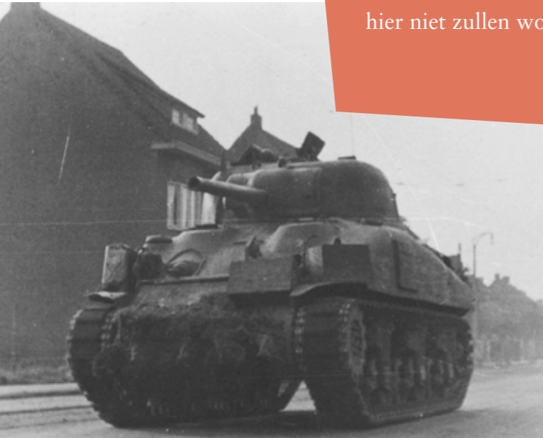
Een Amerikaanse M4 Sherman, waarschijnlijk een M4A3 75mm, middelzware tank rijdt over de Akerstraat-Noord. Dit was op 17 september 1944 de eerste Amerikaanse tank in Hoensbroek. De benzinetanks zijn duidelijk te zien op dit voertuig. In 1944 was dit het belangrijkste type tank van Amerikaanse troepen. Het korte 75mm M3 kanon is duidelijk te zien.

Dit artikel gaat in op de tanks die het meest frequent opdoken in of rondom Heerlen tussen 1940 en 1945. Opgemerkt dient te worden dat tankjagers zoals de in 1944 te Hoensbroek aanwezige Amerikaanse M10 Wolverine en Duitse Jagdpanzer IV tankjager op de Heerlerbaan hier niet zullen worden besproken.