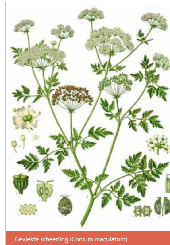
Gevlekte scheerling ( Conium maculatum )