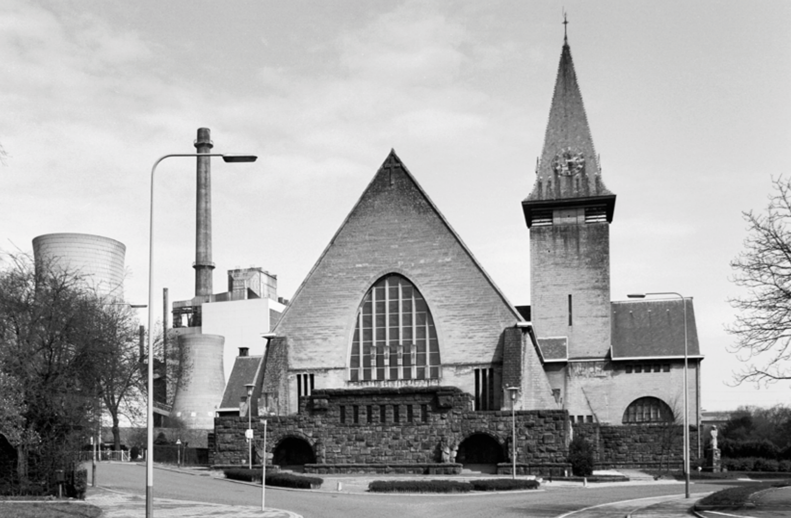
Eygelshoven, Johannes de Doperkerk, westzijde. Foto: Rijksdienst voor het Cultureel Erfgoed, 1983.