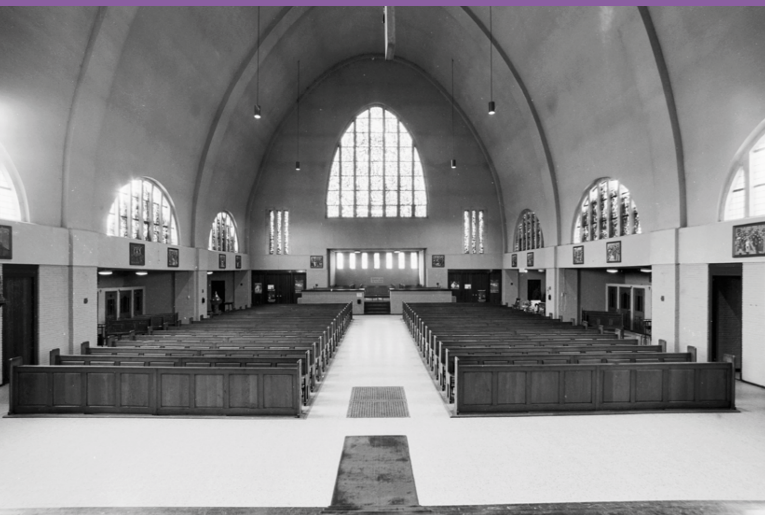
Eygelshoven, Johannes de Doperkerk, interieur naar het westen