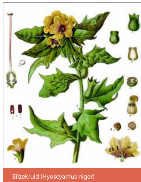
Bilzekruid ( Hyoscyamus niger )