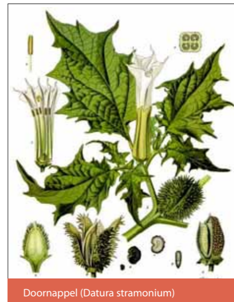
Doornappel ( Datura stramonium )