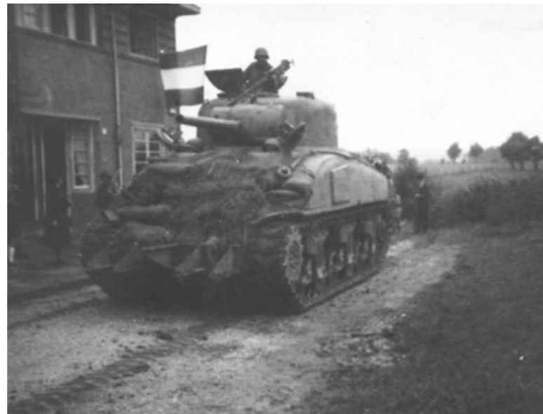
Een Amerikaanse M4 Sherman tank. Het grote 12.7 mm (.50) machinegeweer is hier duidelijk te zien. Met dat wapen konden vliegtuigen beschoten worden. Ook is de tank voorzien van een soort 'scharen' om door heggen te breken.