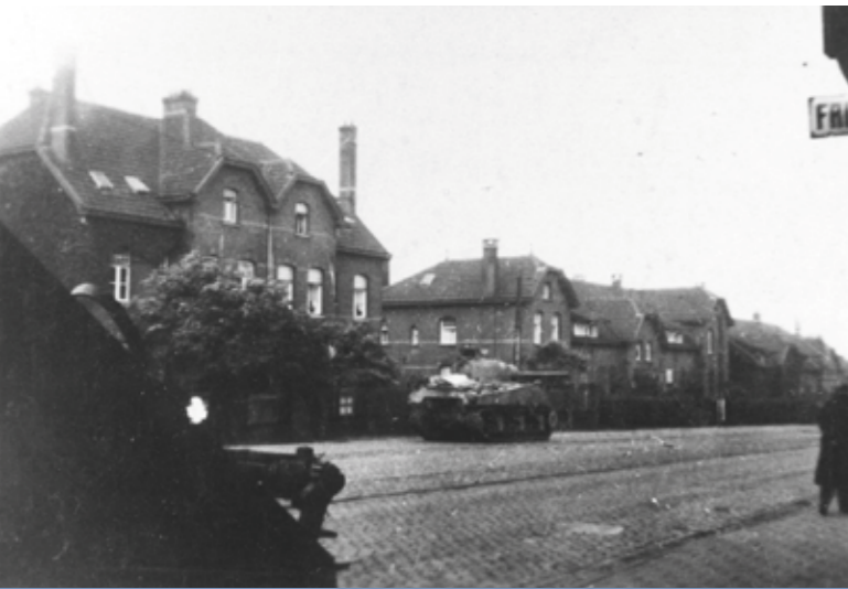
Een Amerikaanse M4 Sherman tank op de Ganzeweide, Heerleheide. Het kanon is naar rechts gericht. Mogelijk aanwezige Duitse troepen? Links vooraan: een andere M4 Sherman tank.

Michel Lemaire, 2017 Stadshistoricus Heerlen