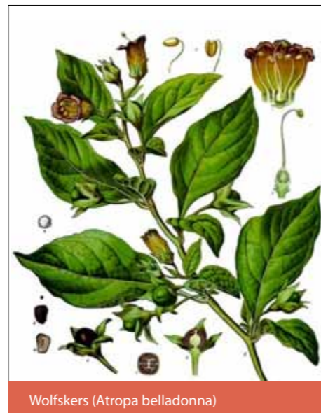
Wolfskers ( Atropa belladonna )