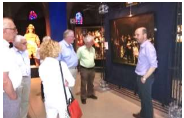
Excursie naar de Rembrandtentoonstelling en het Schutterijmuseum in Steyl op woensdag 3 juli