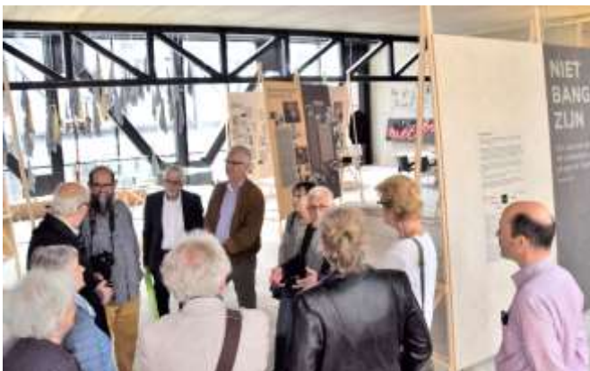
Excursie naar de tentoonstelling 'Niet bang zijn', Migratiemuseum op maandag 27 mei.

Maandag 27 mei vond een eerste korte excursie plaats naar het Migratiemuseum in het Maankwartier in Heerlen.