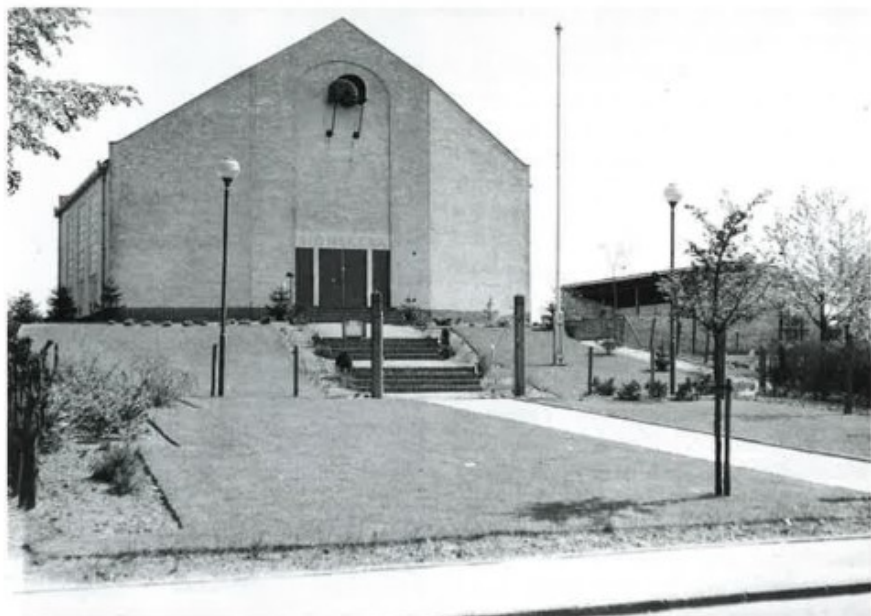
De Sionskerk werd gebouwd aan de Kampstraat te Heerlerheide. Na een half jaar hard doorwerken kon op 23 december 1953 de eerste kerkdienst plaatsvinden.