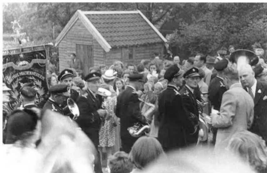
Na een actieve inzamelingsactie vond op zondag 7 juni 1953 de 'eerste-steen-legging' plaats van de Sionskerk. De muzikale omlijsting van dit feestelijke gebeuren werd geboden door Protestantse Harmonie Juliana, hier nog druk in gesprek met het organisatiecomité.