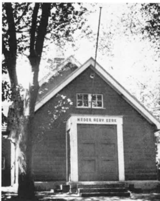
OP HET WRACKE HOUTEN KERCKESKE VAN HOENSBROECK